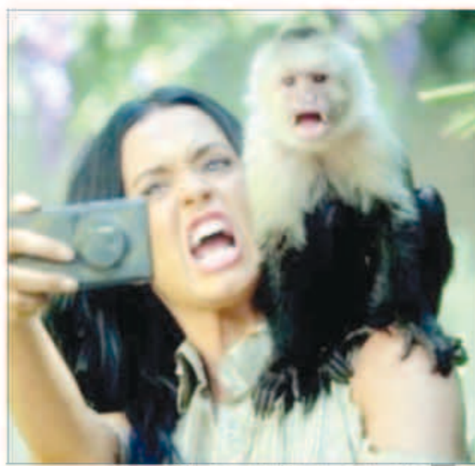
كايتي بيرري تصور أحدث كليباتها مع الحيوانات

تقوم الفنانة العالمية كاييتي بيرري بتصوير أحدث كليباتها لأغنية «Roar» في الطبيعة وبين الحيوانات المفترسة، وتظهر كاييتي في الكليب متناجحة بين الإخصان مع القرد ونصارع التماسيح وتصرخ بوجه النور وتضع طلاء الاظفار لليلة.