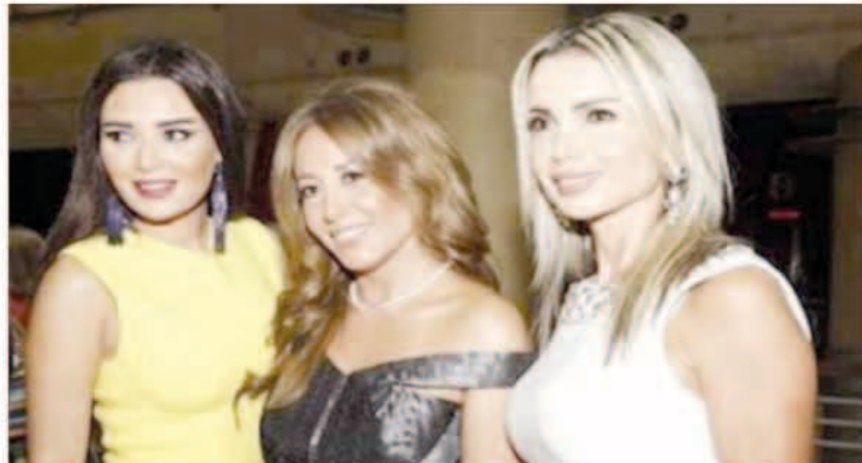
سيرين تشع جمالا بالأصفر