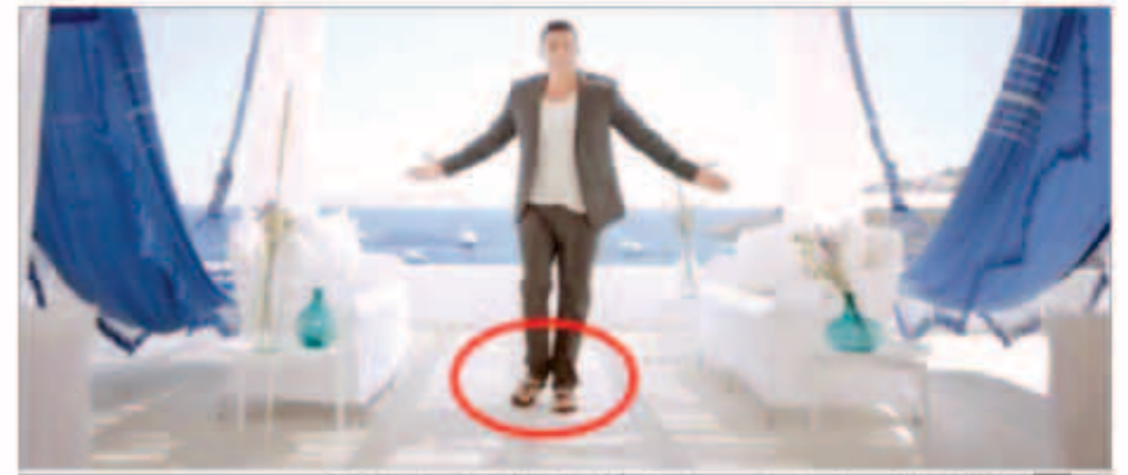
لقطة من الكليب ويظهر فيها عمرو دياب مرتدياً «الشيشب» على طقم ملابس كلاسيكي

على الرغم من أن الخطة التسويقية لشركة روتانا كانت تقتضي بأن تعرض الأغنية المصورة الجديدة للفنان عمرو دياب الليلة بدور العرض السينمائية حتى منتصف أكتوبر المقبل. على أن تعرض على شاشة «روتانا» وعبر «يوتيوب» خلال عيد الأضحى المبارك، إلا أن تسريب الكليب بجودة عالية من دور العرض كما يحدث مع الأفلام السينمائية، دفع الشركة المنتجة لطرحه عبر إحدى شركات المحمول الخاصة لساعات قبل أن يصبح متاحاً للجمهور عبر قناة دياب على «يوتيوب».