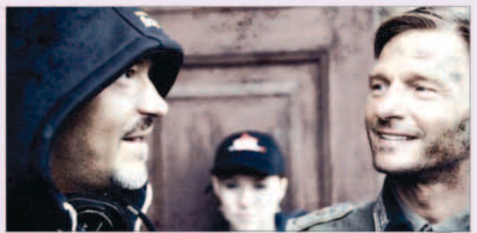
مشهد من الفيلم

والفيلم الذي بلغت ميزانيته 30 مليون دولار، يعتقد على سيناريو أصلي مكتوب للسبتا مباشرة من تأليف إيفان تيلكن الذي قام بدراسة مواد الأرشيف ومذكرات القادة العسكريين الذين شاركوا في معركة ستالينجراد الشهيرة التي كانت بداية هزيمة ألمانيا النازية في الحرب. ويظهر في الفيلم إلى جانب القادة العسكريين من الجانب الروسي، قادة ألمان وجنود يحاولون السيطرة على مبنى سكني في المدينة بينما ظلت مقاومة السكان حتى النهاية إلى أن انحصرت في الساكنة الوحيدة التي بقيت على قيد الحياة مع