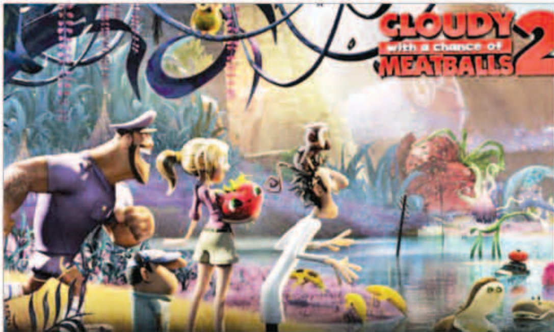
السماء تمطر لحماً تصدر الإيرادات في أمريكا الشمالية

تصدر الجزء الثاني الجديد من فيلم الرسوم المتحركة «السماء تمطر لحماً» Cloudy With a Chance of Meatballs 2 إيرادات السينما في أمريكا الشمالية هذا الأسبوع مسجلاً 35 مليون دولار. الفيلم من إخراج كودي كامبرون وكريس بيرن وبطولة بيل هادر وأنا فارس وويل فورت وجميعهم بالاداء الصوتي فقط. وترجع فيلم «السجناء» Prisoners من صدارة الترتيب في الأسبوع الماضي إلى المركز الثاني ليجمع 11.3 مليون دولار. الفيلم بطولة هيو جاكمان وجيك جيلنهال وفيليا ديفيز ومن إخراج ديني فيلنوف. واحتل فيلم الحركة الجديد «اندفاع» Rush المركز الثالث وحقق 10.3 مليون دولار. وشارك في بطولة الفيلم دانييل برول وكريس همسورث وإخراج رون هاورد ويحكي قصة المنافسة الحميمية بين بطلي الفورمولا 1 في السبعينيات جيمس هانت ونيكي لودا. واحتل الفيلم الكوميدي الجديد «استلام الامتعة» Baggage Claim للمخرج ديفيد توليرت المركز الرابع بإيرادات 9.3 ملايين دولار. ويشارك في بطولة الفيلم بولابا باتون وتاي ديجز. وجاء في المركز الخامس الفيلم الجديد «دون جون» Don Jon للممثل جوزيف جوزون ليفت الذي تولى أيضاً مهمة إخراجة ليسجل تسعة ملايين دولار. ويشارك في بطولة الفيلم سكارلت جوهانسن وجوليان مور.