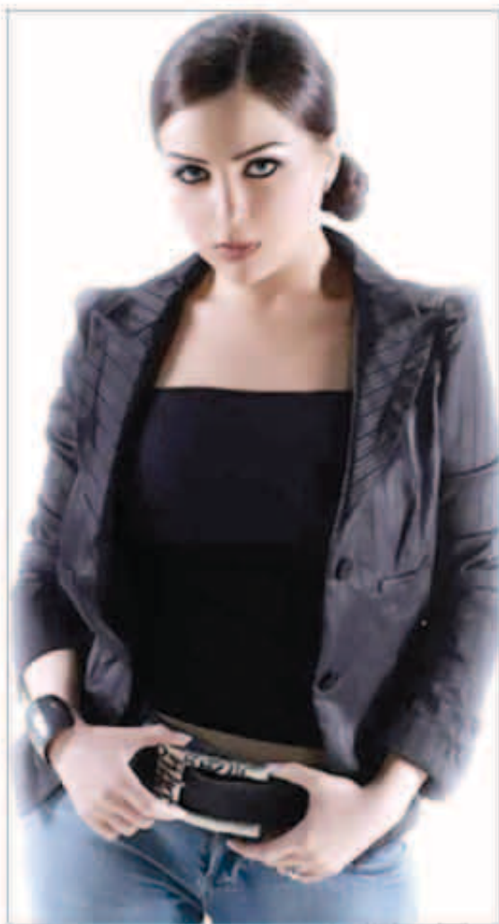
مي عز الدين