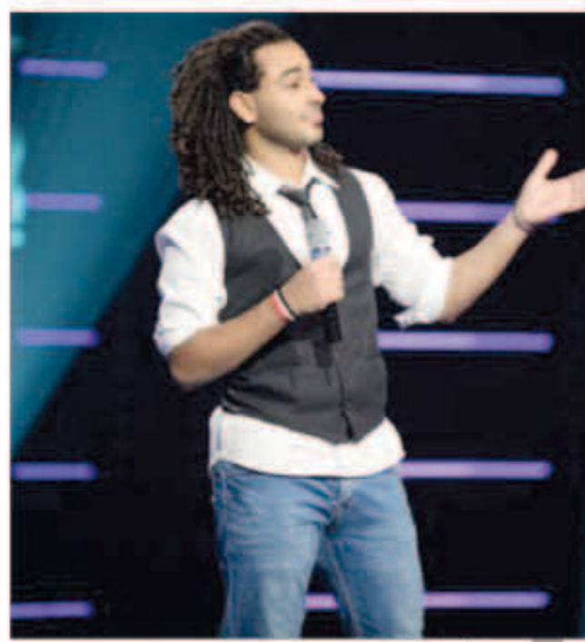
عدد الأصوات المميزة ارتفع

استطاع البرنامج في هذه الحلقة الجديدة تقديم أصوات أفضل من الحلقات السابقة، ولكن على عكس برامج المسابقات الأخرى التي تهتم بالشكل الناعم والملابس والمكياج الخاص بالمسابقين، نرى أن The Winner Is يركز على الطموح والازمات المادية للمسابقين ولا يهتم بفكرة دعم ظهورهم بصورة تتناسب مع الحلقات، فظهر التفاوت بين عدم اهتمام القيمين باتفاق المشاركين وإطلاق إليسا التي أتت في قمة الأناقة والشياكة.