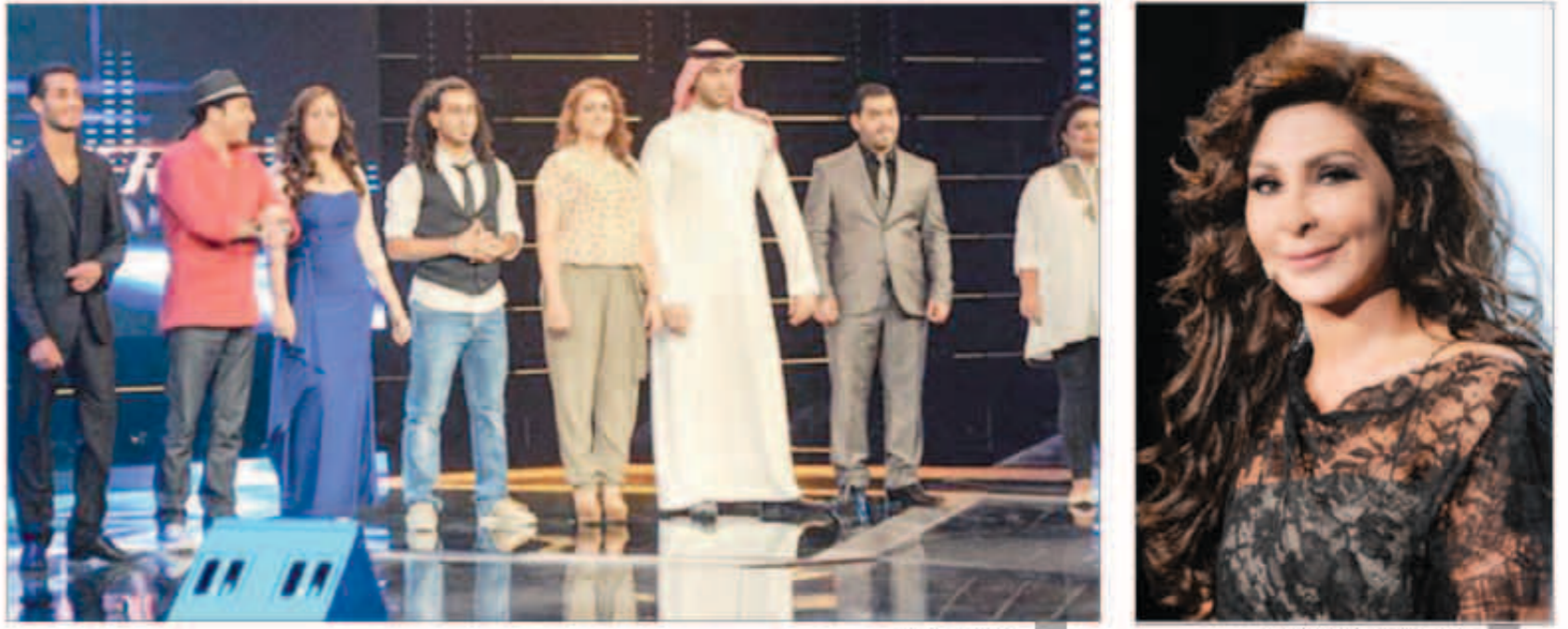
جانب من الحلقة