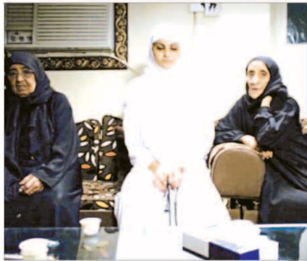
مشهد من فيلم «حرمة».

تطرق «إلى قضايا حساسة ومخظورة وبشكل محترف».