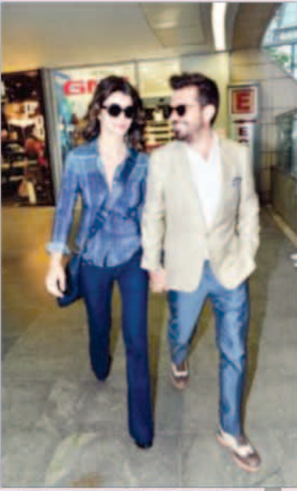
بيرين سات مع حبيبها كينان خلال تسوقهما في كابلون مول باسطنبول

بعد قصة حب استمرت مدة عاصين، قررت الممثلة التركية بيرين سات والمغني التركي كينان دوغلو أخيراً عقد خطوبتهما رسمياً، حيث اتفقا مع أسرتهما على أن تتم الخطوبة في شهر فبراير، حسب العادات والأعراف التركية في حفل سيلتصر على الأهل، على أن يتم حفل الزفاف الرسمي الضخم وقبلها ليلة الحنة التقليدية للعروس في شهر مايو من صيف الـ 2014، حيث ستتم بيرين سات سن الثلاثين من عمرها، بينما يبلغ كينان الأربعين من عمره.