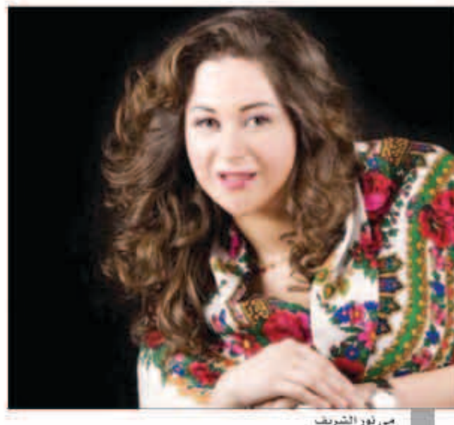
مي نور الشريف

وكان نور الشريف متواجداً في باريس لتكريمه