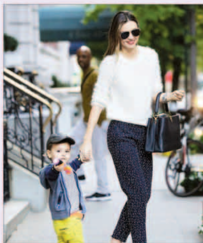
ميراندا كير وابنها

التقطت عدسات كاميرات الباراتري صوراً للنجمة ميراندا كير أثناء مغادرتها المبنى الذي تمكث فيه في نيويورك، وكانت ميراندا برفقة ابنها فلين البالغ من العمر سنتين، الذي يلتفت الأنتظار دائماً، وهذه المرة رفع لعبته بوجه الكاميرات.