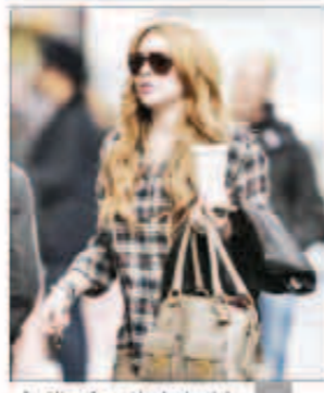
ليندسي لوهان مع كوب القهوة

التقطت عدسات كاميرات الباباراتزي صور النجمة ليندسي لوهان أثناء عودتها إلى البيت الذي تمكث فيه في نيويورك. وكانت ليندسي البالغة من العمر 27 عاماً تحمل كوباً من القهوة. وتأتي إطلاقة ليندسي «التي لها تاريخ طويل مع قضايا الإدمان» بعد أن أثارت التساؤلات في الأيام القليلة الماضية بسبب تشر صورية لها تظهر فيها زجاجة النبيذ التي تشرها تبقى نصفها فقط.