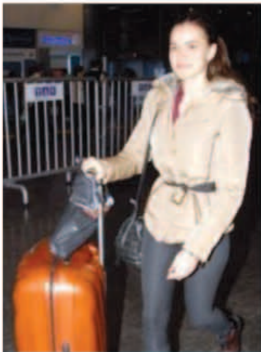
فخرية عجين عائدة من ألمانيا

في أول أيام العيد عن عمر ناهز الـ46 عاماً، بعد صراع استمر خمس سنوات مع مرض السرطان. وكانت الممثلة قد شاركت في تشييع جثمان الراحلة جوليا من جامع مالتيبا.