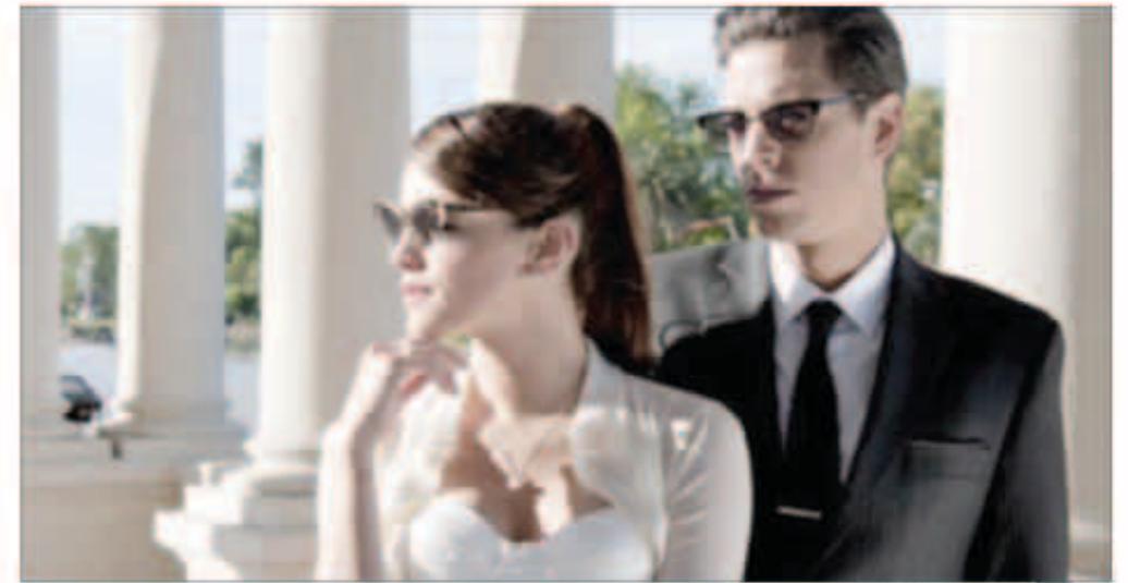
مشهد من العمل

بعد أن ربح قضية تعني الكثير للشركة، كوفي أندريه برحلة إلى أسبانيا، حيث لم يلق هناك فقط مريانا إستيفز «ياولا كرم»، وهي محامية مثالية التقى بها قبل بضعة أيام، بل التقى أيضاً لقاء غامضاً مع الغامض أرتورو نوكرونس، وكيل ورئيس مجموعة «مايونيك لوجيس»، والتي أوسكار وشريكه ماركوس عضوين فيها. بعد هذا اللقاء لن تبقى حياة أندريه على حالها، عندما يعود يواجه قضية مع مريانا نفسها، والتي ترحبها بشكل غير متوقع. يخجو أندريه أخيراً من الخطر وخلال مراجعة ما جرى يدرك أنه ليس هناك شيء لا النلود ولا المجد أو الطموح يمكن أن يكونوا أقوى من الحب.