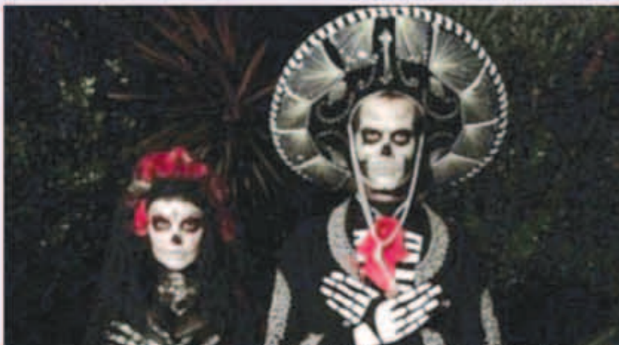
النجمان العالميان فيرجي وجوش دوهاميل في احتفالات الهالوين

الشهيرة، وفضلت ستيفاني بارت أن تحضر الهالوين في إنجلترا، وهي مرتدية ملابس «باسمين» الشخصية الشهيرة بمغامرات علاء الدين. كيلي بروك وزينا الملكة ماري انطوانت النجمة العالمية كيلي بروك، قررت أن تظهر بين أصدقائها في بيفرلي هيلز مرتدية أزياء ملكة فرنسا في القرن الثامن عشر ماري انطوانت، وطلت كيلي حتى الساعات الأولى من الصباح ترقص. وظهرت النجمة وعارضة الأزياء العالمية ألكسندرا امبروسيو بإطلالة إحدى شخصيات «الأميرات اللغزيات» أما فانيسا هاتجينز فقررت أن تنتهز الفرصة لتظهر في إحدى الحلقات في بيفرلي هيلز بولاية كاليفورنيا الأمريكية متخفية بملابس أقرب للملاك..