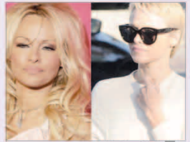
باميلا أندرسون بشعر قصير

اطلت النجمة الأمريكية، باميلا أندرسون، وللمرة الأولى منذ شهرتها، بشعر أشقر قصير، ونشر موقع «بيبول» الأمريكي صورة لطفلة أندرسون الجديدة بعدما تخلت عن شعرها الأشقر الطويل، وخرجت بشعر قصير جداً، وذكر أن الشعر القصير يليق بها إذ أنه يظهر تقاسيم وجهها بدقة أكبر، ويبدو أكثر أناقة. يشار إلى أن أندرسون تسير على خطوات نجما عدة أبرزهن، تشارلين تيرون، وأن هاناواي، ومؤخراً جينيفر هدسون.