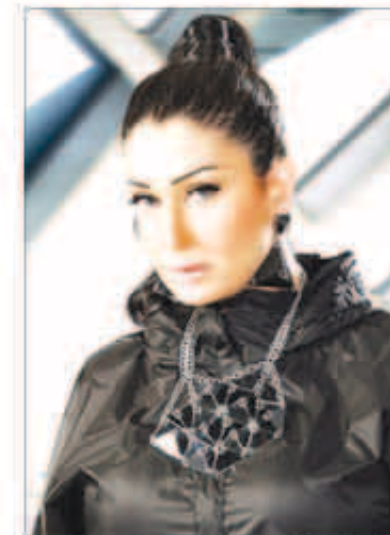
غادة عبد الرزاق