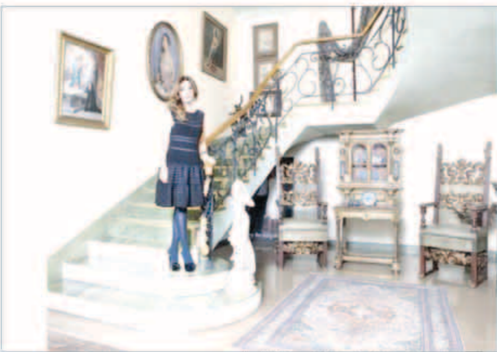
جانسو ستقيم في القصر التاريخي لأشهر عدة تتألف عليه