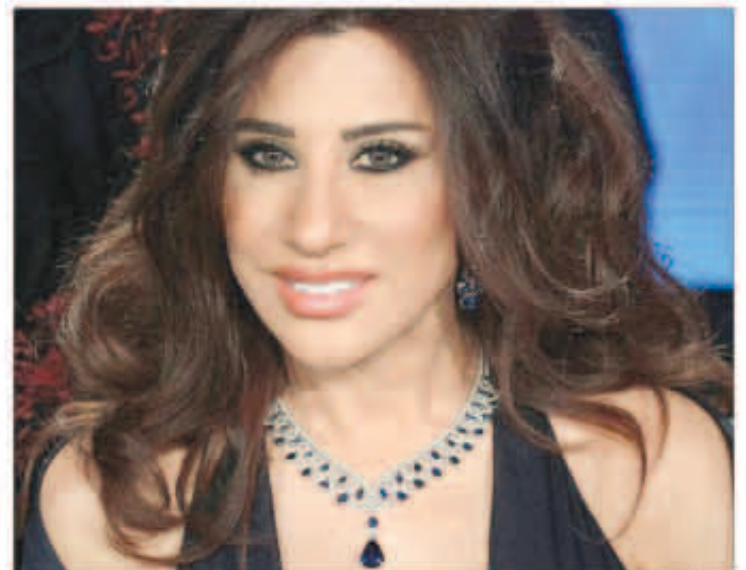
نجوى كرم البقرة كالعادة

أما في ما يتعلق بالمشتركين، فقد اقتضت السهرة مع المشترك بلال حسن، الذي قدم عرضاً يهلوناً لافتاً على المسرح، أظهر من خلاله توازنه وقدرته على الإبداع وخلق