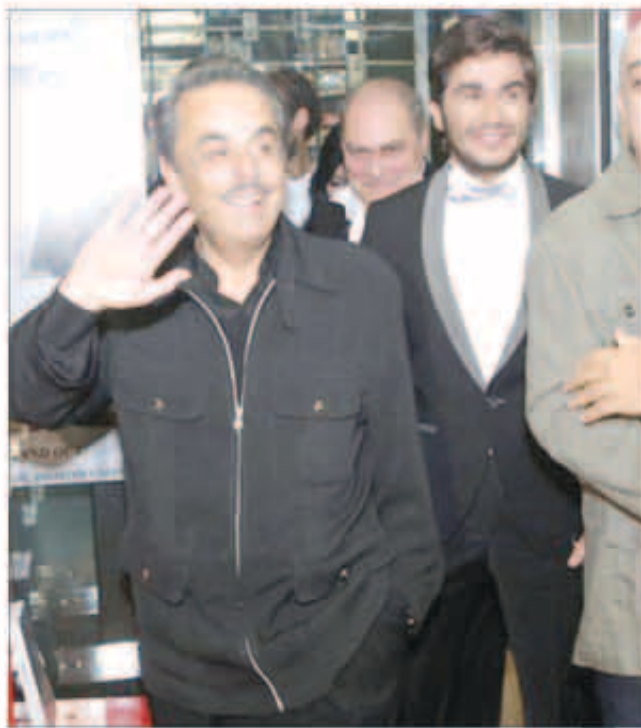
الموسيقار ملحم بركات