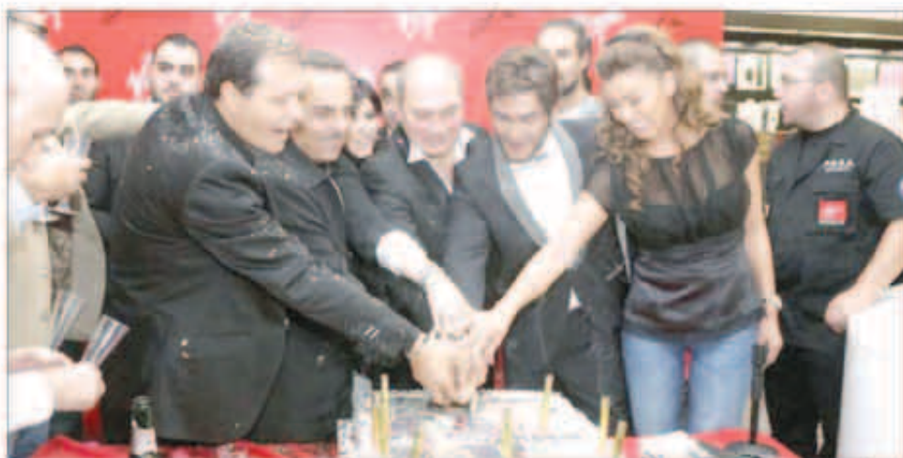
تفطع بككة الحفل