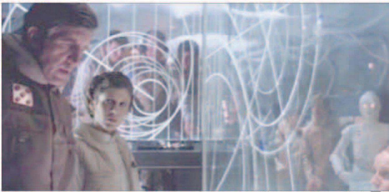
أول صورة لفيلم الخيال العلمي «حرب النجوم 7»

نشر مخرج فيلم الخيال العلمي «حرب النجوم»، في جزئه السابع، أول صورة للفيلم، وهي للروبوت «أر2-دي2» في إطار التحضيرات الأولى للعمل المنتظر إطلاقه في ديسمبر 2015. وذكر الموقع الفرنسي «لكسبريس.اف.ار» أن مخرج الفيلم «جي جي أبراهام» قد وضع صورة الروبوت على حسابه على تويتر، دون الإفصاح عن قصة هذا الجزء السابع من سلسلة أفلام حرب النجوم، وأعلن فريق التمثيل، أو ما إذا كان أبطال الفيلم السابقين سيشاركون في هذا الجزء. وكان الجزء الأول من سلسلة أفلام «ستار وورز» قد تم إخراجها عام 1977، وقدرت مجلة فوربز الأمريكية حصيلته إيرادات سلسلة الأفلام، أولئك أو الألعاب الإلكترونية المنبثقة عنه بـ 20 مليار دولار.