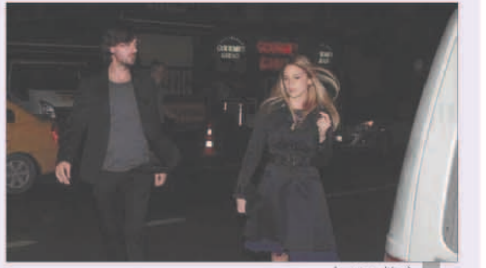
فرح زينب مع حبيبها

حيث تناولوا العشاء معاً في إحدى المطاعم، ثم انتقلت إلى منزلها. بطلة «علي مر الزمان» التي انفصلت عن حبيبها السابق الممثل التركي الكوميدي إيسر بيننيلر منذ ثلاثة أشهر، رفضت الإجابة على أسئلة الصحافيين حول مدى جدية علاقتها بالشخص الجديد، وأكدت بالابتسامة