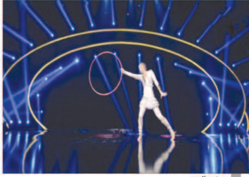
عرض هولاء هوب