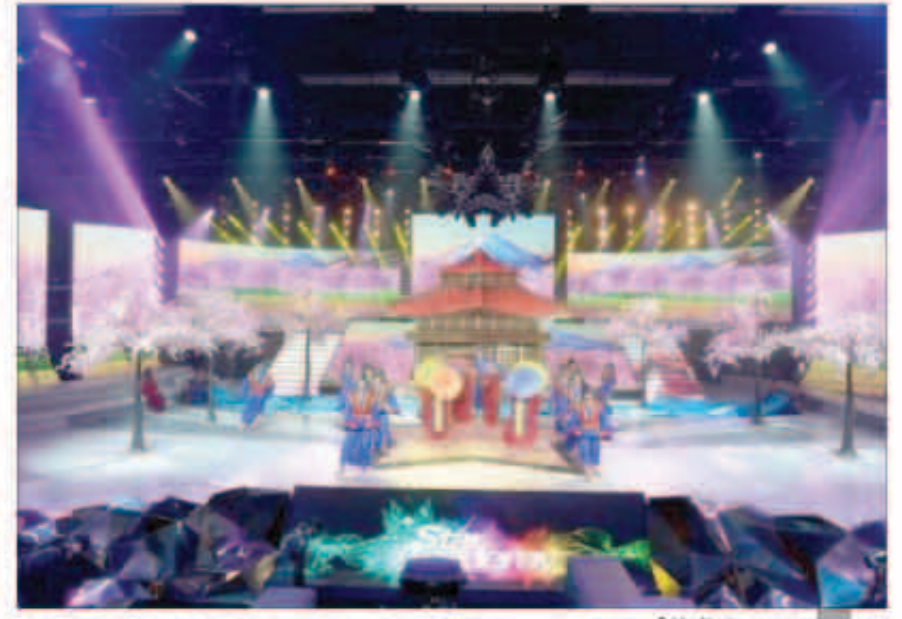
من عروض الحلقة

الحلقة الحادية عشرة من البرنامج تميزت بتقدم واضح للمشتركين