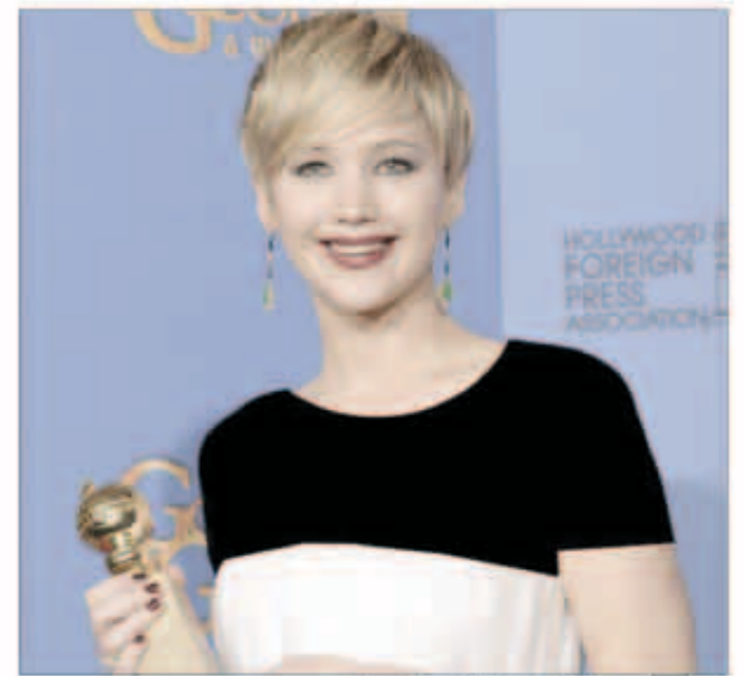
جينيفر لورانس أفضل ممثلة مساعمة