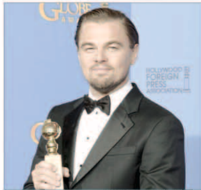
ليوناردو ديكابريو يحمل جائزة