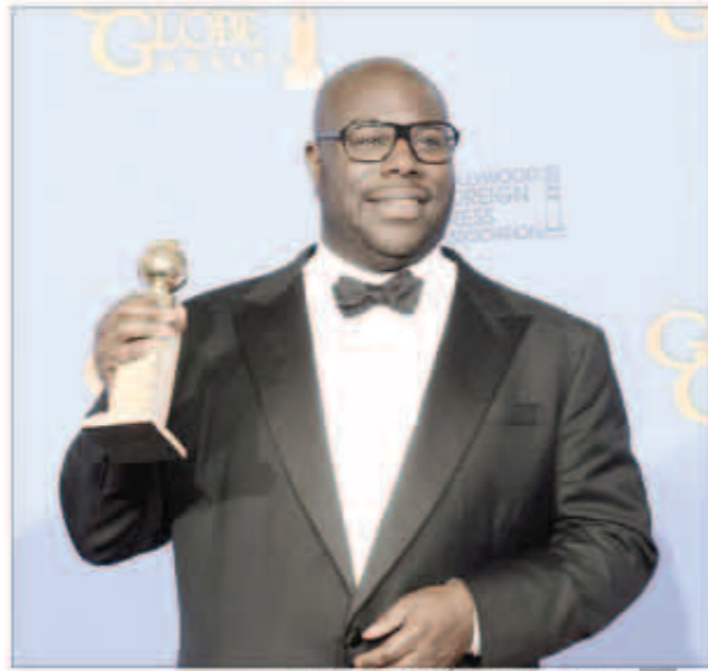
ستيف ماكوين حاملًا جائزة أفضل فيلم