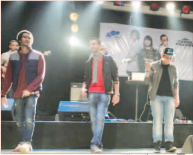
فريق Young Pharoz، أثناء الحفل

أحيا فريق «Young Pharoz» نجوم برنامج اكتشاف المواهب «X Factor» أولي حفلاتهم بالفاخرة والذي أقيم في ساقية الصاوي بالزمالك، وقدم الفريق مجموعة كبيرة من أغانيهم العربية والإنجليزية، بحضور عدد كبير من الجماهير، وقدم الفريق عدداً من الأغاني منها «الليباتشو» «Many need a doctor»، «سلمي يا سلامة»، و«الناس الراقية»، «حتى ورقة»، إضافة إلى أغنياتهم الجديدة «Same Love» و«عدد كبير من أغانيهم التي عبرت عن الوحدة العربية والأحوال التي تدور في المجتمع المصري.