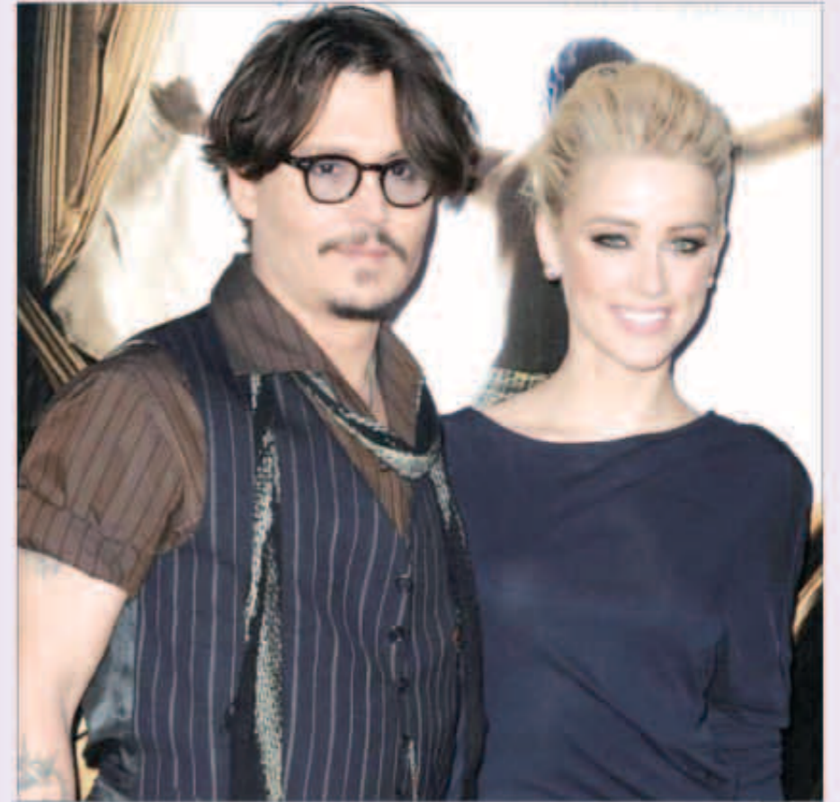
جونني ديب مع خطيبته أمير هيرد

المستقبلية أمير هيرد في موقع تصوير فيلم «The Rum Diaries»، وأعلنوا علاقتهم في يونيو 2012 بعد فترة قليلة من انفصال جونني عن حبيبته فانيسا بارادي التي أنجب منها ابنته ليلى روز «14 عاماً» وابنه جاك «11 عاماً».