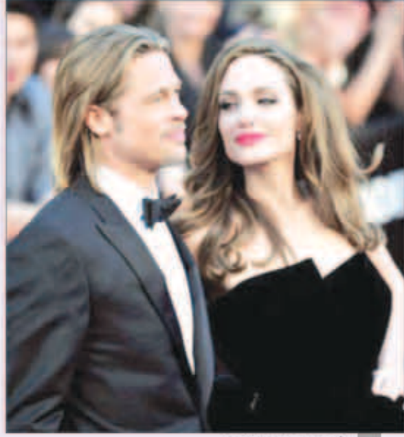
أنجلينا جولي وبرايد بيت

أعلنت النجمة العالمية أنجلينا جولي والنجم برايد بيت أنهما قررا وبشكل نهائي أن يضموا إلى أسرتهما طفلة، وذلك رغم من أن لديهما 6 أبناء، فأعلن موقع «بوش» الفني الشهير أن برايد بيت وأنجلينا جولي قالا إنهما في طريقهما لضم طفلة جديدة لأسرتهما. فقد أعلنت مجلة «Grazia» أن برايد وأنجلينا ظلا فترة طويلة وصلت لعدة أشهر في مناقشات من أجل الوصول لهذا القرار وأن تزييد أسرتهما فردا جديدا، حيث يجب الثنائي الأطفال بشكل واضح ومتحمسان الآن للفكرة وأعلن عدد من المواقع أن تنفيذها سيكون قريبا جدا، ومن المحتمل أن تكون الطفلة الجديدة من «إثيوبيا» مسقط رأس ابنتها زهرة.