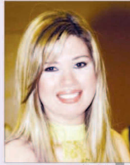
رانيا فريد شوقي

أكدت الفنانة رانيا فريد شوقي لـ «اليوم السابع»، أنها لم تستقر على أي عمل درامي جديد تخوض من خلاله السباق الرمضاني المقبل، موضحة أن انشغالها كله يتركز حالياً في مسرحية «لما الشعب يفسح»، مع أحمد بدير وسامي مغاوري، من تأليف محمود الطوخي، وإخراج شادي سرور، مشيرة إلى أن هذه المسرحية تلقي الضوء على العلاقة التي يجب أن تكون بين الحاكم والشعب.