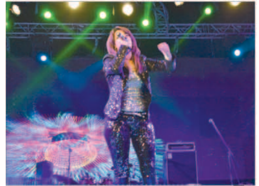
أمينة أثناء الحفل

في جمعية مستثمري البحر الأحمر. وفوجئت أمينة أثناء غنائها بصعود الفنانين عمرو عبد العزيز وأبو الليف وسوسكا وشريف باهر وقاموا بالرقص معها مما ألهب حماس الجمهور الذين حرصوا على متابعة المهرجان والمشاركة في فعالياته.