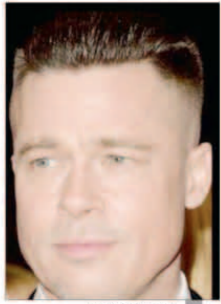
براد بيت باللوك الجديد

الآلاف من جمهور مدينة الغردقة حرصوا على حضور حفل الفنانة المصرية أمينة التي أشعلت المارينا السياحي بأغانيها حيث قدمت العديد من الأغاني منها الحظوظ ويا مراكي وأغنية مش بتاع جواز كما قامت بغناء موال بدون موسيقى بعد أن