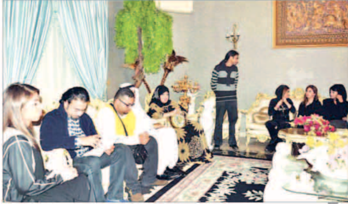
مشهد من العمل