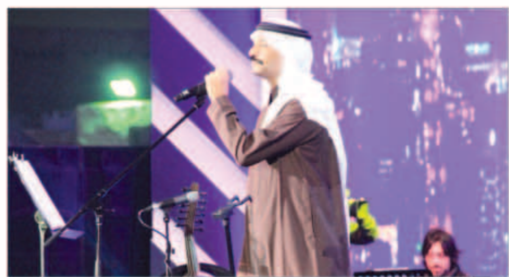
عبادي الجوهر أثناء الحفل