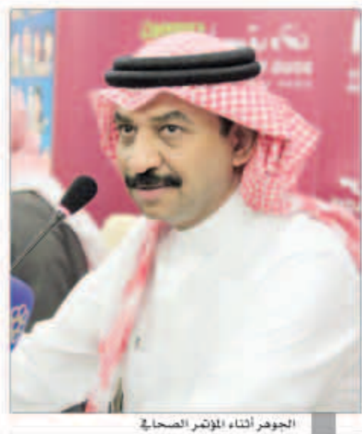
الجوهر أثناء المؤتمر الصحافي

تألق الفنان الكبير المبدع عبادي الجوهر في حفلته أمس الأول بسوق واقف وقدم العديد من أغانيه الجديدة التي جعلت عشاق الطرب يستمتعون بكل ما قدم لهم. وكان الجوهر قد عبر عن سعادته بالتواجد للمرة الثانية على التوالي في الحفلات الغنائية لمهرجان ربيع سوق واقف، مشيراً إلى أن هذا التواجد دليل على حب الجمهور الذي يبادله حياً يحب واحترمه صغيراً وكبيراً، منوها إلى أنه يقترن دائماً بالحفلات الغنائية التي يحييها في قطر التي كانت أول بلد ينطلق منه إلى باقي دول الخليج عندما شارك عام 1976 في افتتاح دورة الخليج الرابعة التي احتضنتها قطر خلال هذا العام. وكشف عبادي الجوهر خلال مؤتمر صحافي عقده بهذه المناسبة قبل حفلة الغنائي أنه انتهى من تجهيز ألبومه القادم الذي سيضمه تسعة أعمال لا يزال حائراً بين عنوانين يفكر في إطلاقه عليه وهما