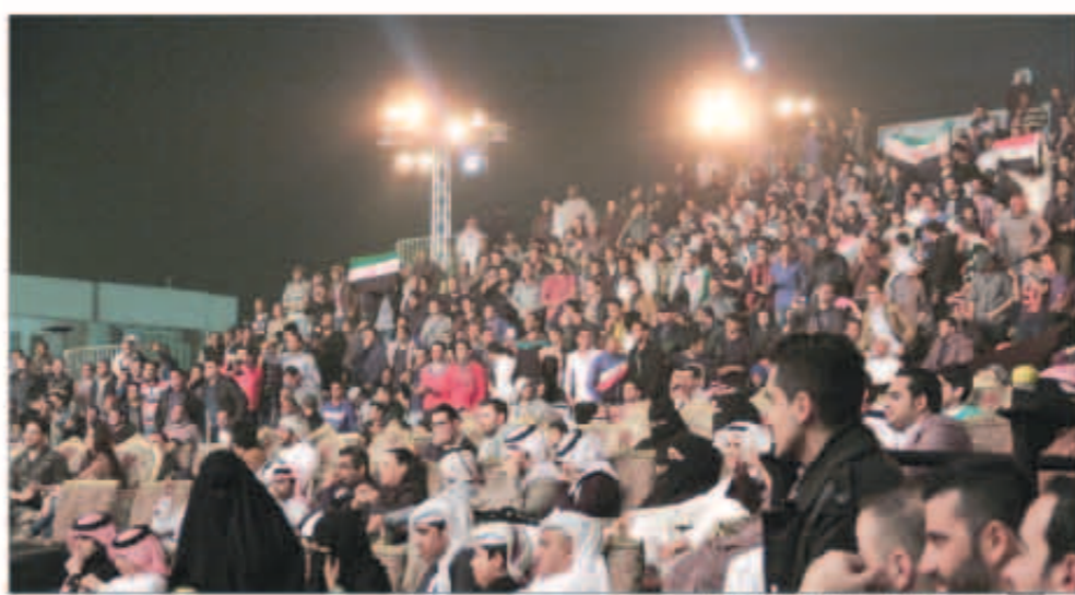
جمهور كبير استمتع بالغناء الأصيل