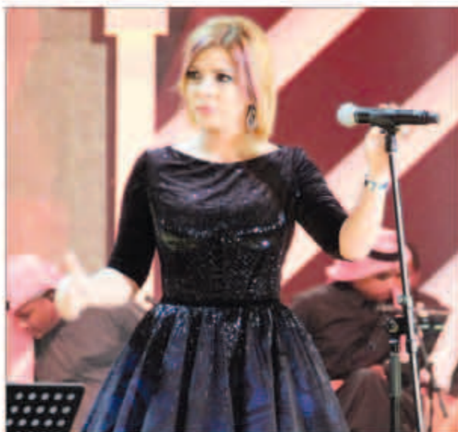
أصالة على مسرح سوق واقف

عليا أكدت النجمة الكولومبية اللبنانية الأصل أن حياتها تغيرت بشكل كبير منذ أطلقت ألبومها الموسيقي الأخير حيث «دخلت واحدة من أكثر مراحل حياتي سعادة، كان هذا وقت التغيير واستكشاف النفس، وبالطبع أصبحت أما وهذا ما قلب عالمي رأساً على عقب بالطريقة الأفضل طبعاً عن الأغنية والألحان التي لم أكتبها بعد، ففي الموسيقى احتمالات لا متناهية».