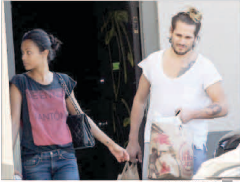
زو سالدانا وماركو بيرينغو