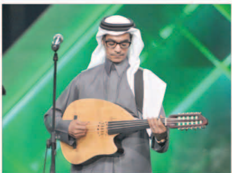
رابح صقر وعزف على العود