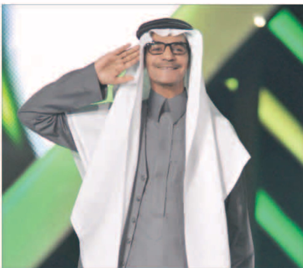
رابح صقر وتحية عسكرية

واغتميه «صدقيني عجزت انساك» والتي استعرض فيها طوقاته الصوتية وغنى «الحكاية باختصرها بكلمتين» ويمر الحزن وهانت علي وجرح تصبروالي تكلمي كذا واستمر التصفيق حتى بعد خروج رابح من المسرح فقد كانت ليلة رابحة.