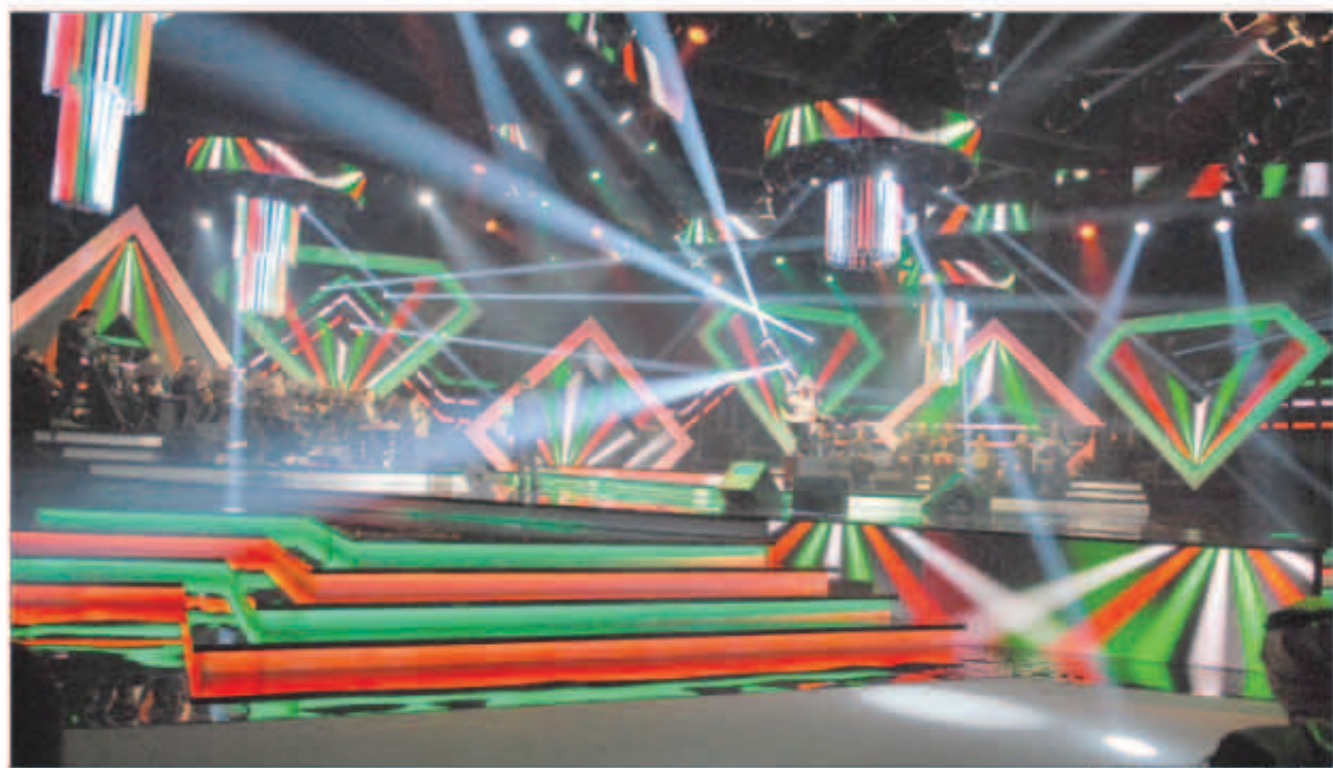
حفلة ناجحة بكل المقاييس