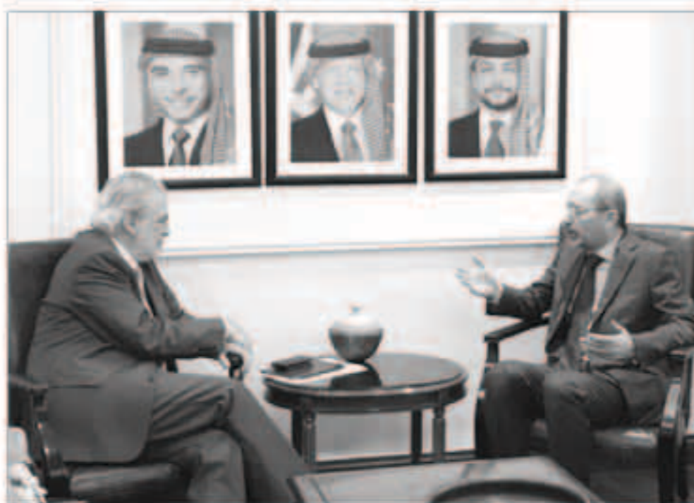
وزير الخارجية الأردني أيمن الصفدي خلال لقائه كريستوس ستيليانيس

عمان - «وكالات»: دعا الأردن المجتمع الدولي إلى توفير الدعم الكافي لمساعدته على تحمل عبء تلبية احتياجات مليوني لاجئ فلسطيني، ألف سوري تستضيفهم الملكة حاليًا. وطالب وزير الخارجية وشؤون المغتربين الأردني، أيمن الصفدي، خلال لقائه في عمان مفوض المساعدات الإنسانية والإدارة الأزمات في ستيليانيس، باستمرار المجتمع الدولي بالتزاماته إزاء اللاجئين السوريين، محذراً في الوقت نفسه من مخاطر تراجع الدعم الدولي للاجئين والدول المضيفة لهم.