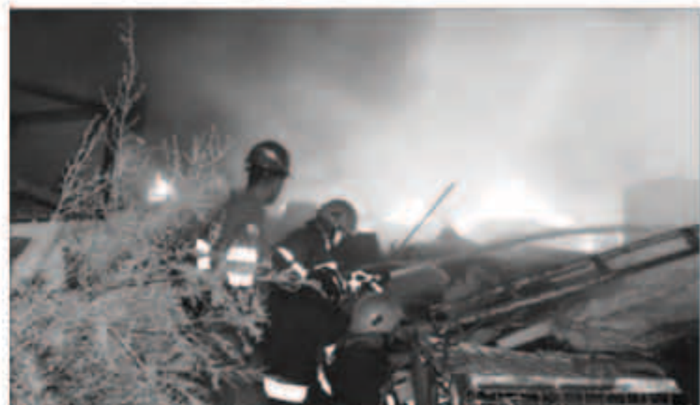
عناصر من الدفاع المدني العراقي تحاول السيطرة على الحريق

بغداد - «وكالات»: سقطت عدة قذائف صاون على قرى بمدينة هيت في محافظة الأنبار العراقية، وذلك عقب انفجار مخزن عتاد تابع لميليشيا الحشد لأسباب مجهولة. والأحد مصادر أمنية عراقية، بحسب «السومرية نيوز»، أن «حريقاً اندلع مساء الإثنين في مخزن عتاد داخل مقر تابع للحشد في قضاء هيت بمحافظة الأنبار»، مبيّناً أن «عدداً من القذائف تعاقبت على القرى القريبة». وأكدت المصادر أن فرق الدفاع المدني العراقي تمكنت من السيطرة على الحريق. يذكر أن عدداً من المواقع العسكرية التابعة للحشد تعرضت في وقت سابق إلى اندلاع حرائق أدت إلى إلحاق أضرار مادية كبيرة، فيما أشار مسؤولون حكوميون أن الحريق ناتج عن قصف بطائرات مجهولة. من ناحية أخرى أعلن جهاز مكافحة الإرهاب العراقي، الإثنين، عن مقتل 15 عنصراً من تنظيم داعش والقوات الفض على 9 آخرين في منطقتي مطبيجة وصحراء صلاح الدين في محافظة صلاح الدين بانزلال جوي فلاح بالتنسيق مع التحالف الدولي. وبحسب صحيفة «الحياة» العراقية، أمس، قال الجهاز في بيان إن فواته وبالتنسيق مع طيران التحالف الدولي نفذ عمليات إنزال جوي في منطقتي مطبيجة وصحراء صلاح الدين أسفرت عن مقتل 15 إرهابياً، من ضمنهم انتحاريون. كما أشار إلى إلغاء القبض على 19 آخرين إضافة إلى تدمير عدة مضافات وكهوف واتفاق ومعسكر تدريب لأدش بضربات جوية من قبل طيران التحالف.