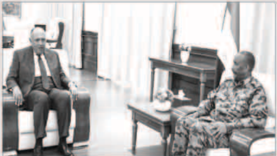
رئيس المجلس الانتقالي السوداني الفريق أول ركن عبدالفتاح البرهان والوزير المصري سامح شكري

الخرطوم - «وكالات»: أكد رئيس مجلس السيادة الانتقالي السوداني الفريق أول ركن عبدالفتاح البرهان، الإثنين مائة وأربعة والعشرون عاماً، وتطورها على كل المستويات. وأشار البرهان، لدى لقائه بمكتبه بالقصر الجمهوري وزير الخارجية المصري سامح شكري ووفد وكالة الأنباء السودانية، سونا، إلى الروابط التاريخية التي تربط الشعبين الشقيقين. وأكد شكري في تصريحات، عقب اللقاء، خصوصية العلاقات بين البلدين، وقال إن المحادثات بين الجانبين تناولت محمل العلاقات الثنائية، وتفعيل آليات العمل المشترك، واللجان الفنية بين البلدين. من جهتها، أكدت وزيرة الخارجية أسماء محمد عبدالله أن المحادثات إيجابية وكانت في أجواء أخوية، والاتفاق على استمرار التعاون بين البلدين في كل المجالات، وتفعيل عمل اللجان الفنية المشتركة بين الخرطوم والقاهرة.