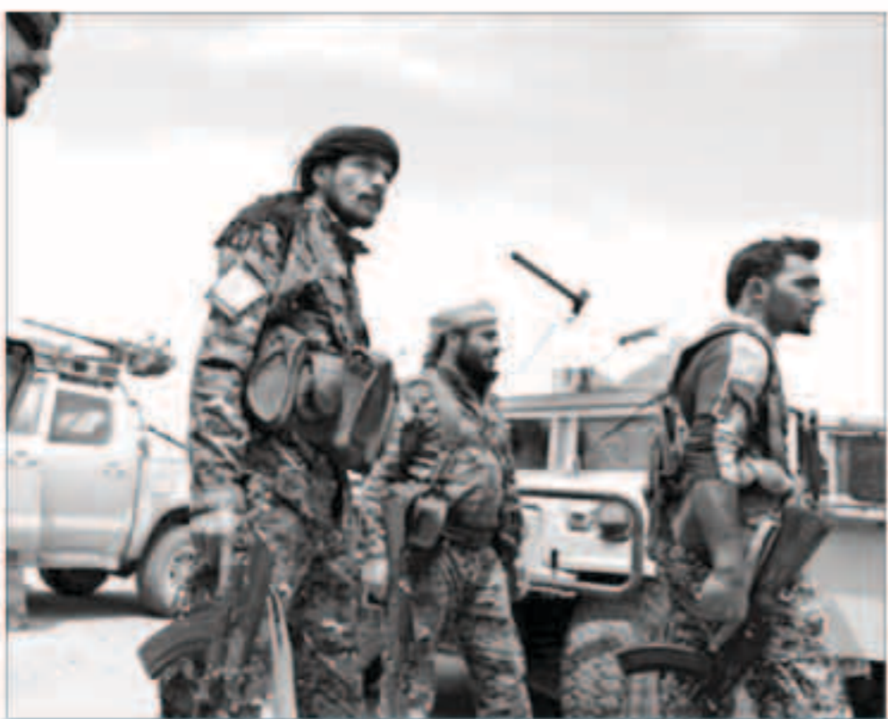
عناصر عسكرية في سوريا

وكان المرصد أشار في بيان سابق، أن الميليشيات الإيرانية المستطرة على مدينة الميادين بريف دير الزور الشرقي، عمدت إلى اعتقال عناصر من ميليشيا الدفاع الوطني التابعة للنظام في المدينة، بعد أن رصدت كاميرات سرية موضوعة على دراجات نارية يستقلها عناصر من الدفاع الوطني صوراً عن مقرات تابعة للإيرانيين، وذلك في إطار التوتر المتصاعد بين الطرفين في المنطقة والحفلة الإيرانية للحد من نفوذ ميليشيا الدفاع الوطني في الميادين.