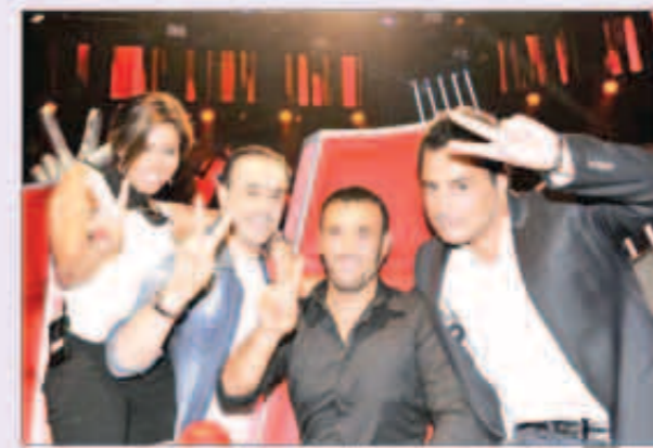
«ذا فويس» بدء موسمها الثاني بنفس الحكام

يشتمل البرنامج على عدد من التغييرات النوعية في البنية والهيكلة، إلى جانب مفاجآت وتطوير المحتوى، تطال طريقة التماهل والاختيار وإعداد المتاملين. على أن يتم الكشف عن تلك التطويرات والمفاجآت تباعا، وبالتفصيل، مع اقتراب موعد العرض على MBCI و MBC. على بنائه وتدعيمه بأفضل الأصوات المشاركة، والارتقاء بها نحو المراحل المتقدمة من البرنامج وصولا إلى المرحلة النهائية. أبرز ما يميز الموسم الثاني هو النوعية النادرة للأصوات المشاركة التي حرص طاقم البرنامج على اختيار نخبتها، في موازاة ذلك،