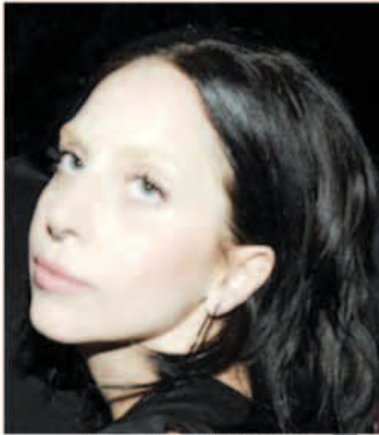
مكياج ليدي غاغا اظهرها بوجه صاحب للغاية