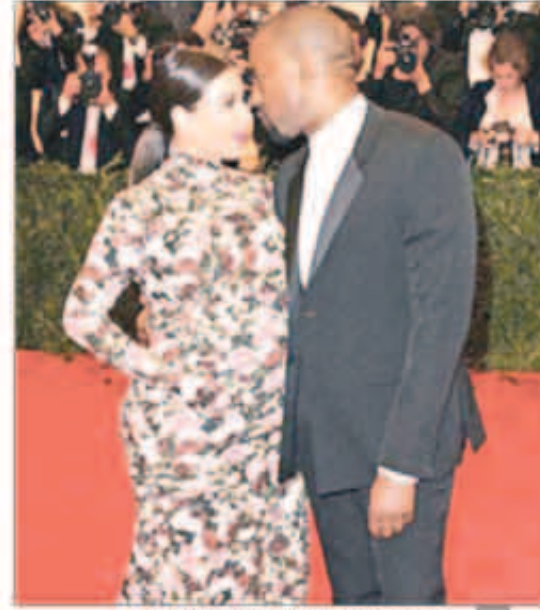
توب غير مناسب لكيم كارديشان في الحمل