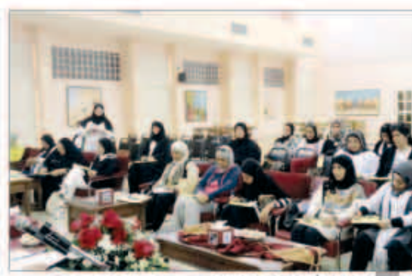
رئيسات اقسام التربية البدنية