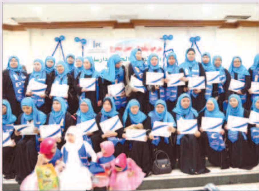
صورة جماعية للمسلمات الجدد

ضمن أعمال ودورات مشروع علمي الإسلام احتفلت لجنة التعريف بالإسلام بفرع المنقف النسائي بتخريج كوكبة من المسلمات الجدد ودارسات اللغة العربية حيث بلغ عدد الخريجات 150 دارسة من المسلمات الجدد، في صلاة أفرح جمعية ضاحية جابر العلي.