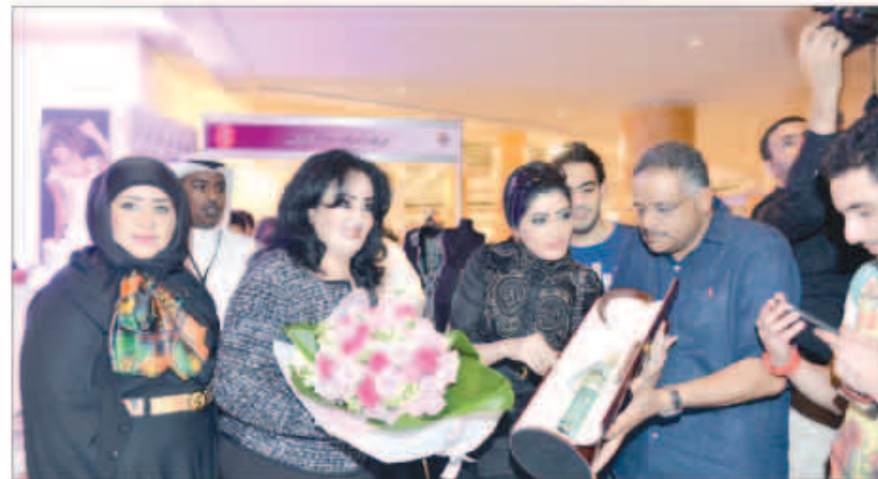
تقديم درج المعرض للشبيخة أمل الحمود الصباح