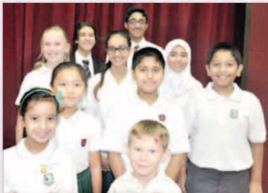
استقبال مميز بالعودة إلى المدرسة

استقبلت مدرسة الكويت الإنكليزية طلابها بحفل مميز حيث قامت الهيئة التدريسية بالترحيب بهم ولا سيما المستجدين لكسر حواجز الرهبة في نفوسهم.