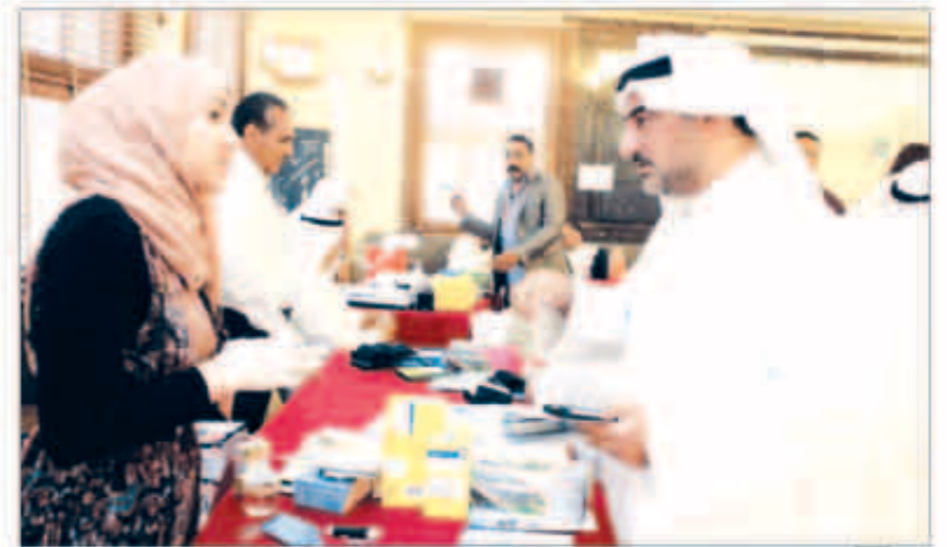
الرد على الاستفسارات