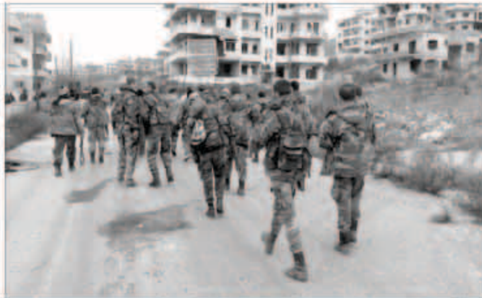
عناصر من جيش النظام السوري تحاول الانتشار على حساب المقاومة المسلحة

فسيخسروا دعم حلفائهم، وأضاف ماخوس أنه إذا لم يكن هناك اتفاق على جوهر العملية السياسية فستقبل محادثات جنيف المرتقبة، مؤكداً أنه من الأفضل عدم الدخول في عملية 'فاشلة'. وجدد ماخوس - وهو عضو الهيئة العليا للمفاوضات - مطالبة المعارضة للنظام السوري بإجراءات لتحسين التنمية قبل الشروع في المفاوضات. وذلك عبر وقف القصف وإطلاق سراح بعض السجناء من النساء والأطفال والشيوخ، مؤكداً أن وفد المعارضة لن يذهب إلى جنيف ما لم تتحقق تلك الإجراءات.