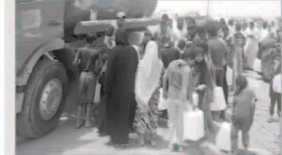
أوضاع النازحين في العراق تزداد سوءاً رغم تدريبات الأمم المتحدة

المعارك بين القوات العراقية وتنظيم الدولة في مناطق مختلفة من البلاد، وخاصة في مدينة الرمادي مركز محافظة الأنبار غربى العراق. وقال ممثل مفوضية شؤون اللاجئين في العراق برونو جينو في أرييل إن المشكلة الأساسية التي تواجه المنظمة أنها أمام أزمة تجرى من النازحين العراقيين واللاجئين السوريين.