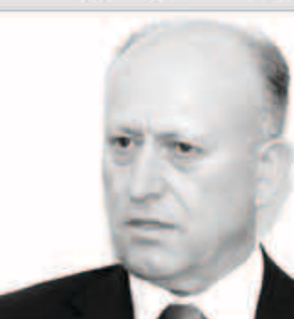
وزير العدل اللبناني المستقيل اللواء أشرف ريفي

بيروت - «وكالات»: أعلن وزير العدل اللبناني المستقيل، اللواء أشرف ريفي، «إننا بخلفنا الحكومة من أجل تأسيس حكومة ربيط نزيه، بمعنى آخر أننا نتعاون ككتائبين وإنما مختلفون على وضع حزب الله، في المرحلة الأولى كانت الأمور متوازنة إلى حد ما إلى حين وصولنا إلى بدء سيطرة حزب الله على القرار الحكومي وغرفته الأمور الحياتية والأمنية والعلاقات العربية لدرجة أننا وصلنا إلى أزمة كبرى في 3 ملفات أساسية يعرقلها الحزب في الخفاء، من أجل التأسيس لشاكل اجتماعية يمكن تجييرها في أي وقت».