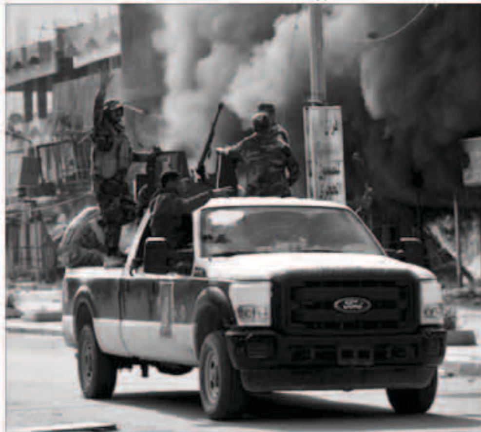
عناصر من الحشد الشعبي في تكريت