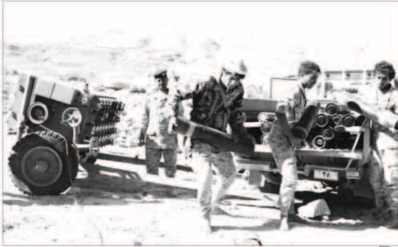
عناصر من الجيش اليمني