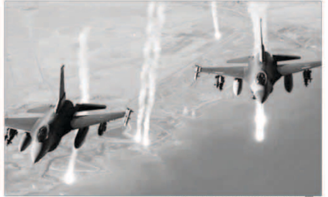
مقاتلات التحالف تستهدف مواقع للانقلابيين في صنعاء وتعز ومأرب وعمران

المنازل أملا بالصالح الجريمة به. كذلك تظهر صور، إلى جانب الفيديو، انتشارت بسرعة على مواقع التواصل الاجتماعي، انتهاكات جسيمة مماثلة اعتدتها الميليشيات حيث اتبعت الإجراءات نفسها تماما. وكما هو واضح فإن أسلوب ارتكاب الجرائم ونشر الإشاعات في محاولة لتصفيتها بالتحالف أصبح له مفعول عكسي. فبدلاً من نجاحه دل ويوضح على الحجم الكبير للتهديدات والانتكاسات في صفوف الميليشيات بسبب الخسائر المتوالية التي لحقت بها طائرات التحالف وقواته، وقوات المقاومة الشعبية وقوات الشرعية في أنحاء اليمن.