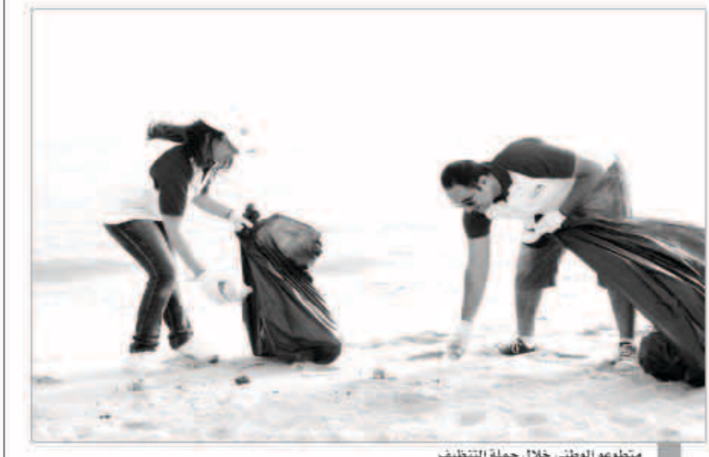
متطوعو الوطني خلال حملة التنظيف