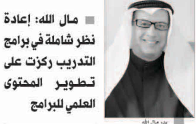
بدر مال الله

أعلن المعهد العربي للتخطيط المؤسسة العربية الإقليمية المشتركة والمتخصصة في دعم المسيرة التنموية في الدول العربية - عن إطلاق موسمه التدريبي لهذا العام من خلال مجموعة من البرامج التي تتنجم مع أهدافه الأساسية وتدعم الجهود التنموية في العالم العربي، وتأتي هذه البرامج ضمن الهيكل الأساسي للمعهد في إطار برامج الشهادات المتخصصة. وقال مدير عام المعهد العربي للتخطيط د. بدر مال الله: «بعد التدريب وبناء القدرات من النشاطات الرئيسية التي درج المعهد على تنفيذها منذ عقود، وذلك إلى جانب اختصاصاته الرئيسية المختلفة كالدعم المؤسسي والاستشارات، البحوث والقراءات العلمية وغيرها مشيراً إلى ان الموسم التدريبي الذي يبداه المعهد في مقره ببنغازي تحت مسمى الهيكل الأساسي للتدريب، وذلك إلى جانب ثلاثة شرائح أخرى من بينها الشهادات التدريبية المتخصصة خارج دولة المقر والتي يجري تنفيذها في الدول العربية، البرامج التدريبية الخاصة لصالح جهات ومؤسسات حكومية في دولة الكويت، وأخرى بناءاً على طلب المستفيد، وأضاف