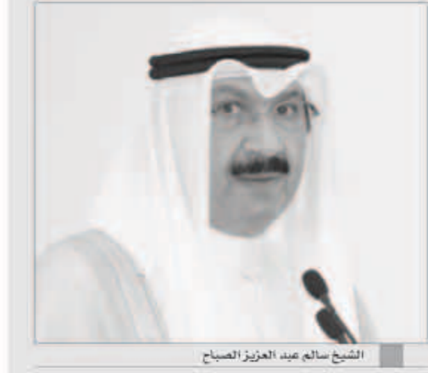
الشيخ سالم بن عبدالعزيز الصباح

تلقى نائب رئيس مجلس الوزراء وزير المالية الشيخ سالم عبد العزيز الصباح صحة رسالة وقف الدعم المالي عن جمهورية مصر العربية التي تناقلتها بعض برامج وبيانات التواصل الاجتماعي في الآونة الأخيرة. وأكد الشيخ سالم في تصريح لوكالة الأنباء الكويتية «كويتا» امس انه «لا حقيقة لرسالة وقف الدعم المالي عن مصر التي جرى تداولها أخيراً، مبيّناً أنها «مختلقة شكلاً ومضموناً ولا تمت للواقع بصلة». وشدد على ان وزارة المالية لم ترسل خطاباً رسمياً تعترض بموجبه عن عدم تقديم الدعم المالي لمصر كما جاء في الرسالة المذنية باسمه واصفاً إياها بـ «المزورة والمخافية للحقيقة».