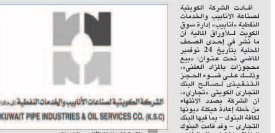
الشركة الكويتية للصناعات الأنبوبية والخدمات النفطية (ك.س.ك)

أفادت الشركة الكويتية لصناعة الأنابيب والخدمات النفطية «أنابيب» إدارة سوق الكويت للأوراق المالية أن ما نُشر في إحدى الصحف المحلية بتاريخ 24 نوفمبر الماضي تحت عنوان: «بيع محجوزات بالمراد العنق»، وذلك على ضوء الحجز التنفيذي لصالحه البنك التجاري الكويتي «تجاري»، أن الشركة بصدد الانتهاء من خطة إعادة مبيعاتها لكافة البنوك - بما فيها البنك التجاري - وقد قامت البنوك الدائنة باختيار بنك الخليج «كبنك قائد» بتاريخ 24 ابريل 2013. وقد وصلت المفاوضات إلى مراحلها النهائية. وبالرغم من الإنفاق الضمئي مع كافة البنوك على عدم اتخاذ إجراءات قانونية من شأنها عرقلة أو تأخير التوقيع على اتفاقية جدولة الديون إلا أننا فوجئنا بالإجراء المتخذ من قبل البنك التجاري منفرداً عما اتخذته كافة البنوك من قرارات وإجراءات بشأن ذلك. وأوضحنا الشركة في البيان أنها تجري حالياً المفاوضات لإيقاف هذا الإجراء، وسيتم