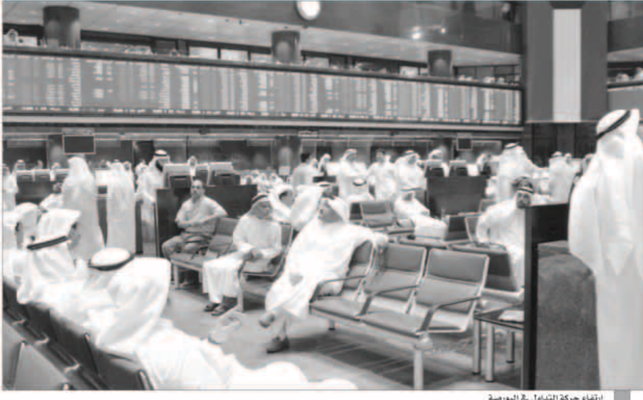
ارتفاع حركة التداول في البورصة

نشاط مستويات السيولة وبقيائها فوق مستوى 30-35 مليون دينار كويتي للجلسة. انشط القيم استطاع سهم «المستثمرين» أن يتصدر قائمة انشط تداولات البورصة الكويتية على مستوى الكميات، حيث بلغ حجم تداولاته في نهاية تعاملات 160.3 مليون سهم تقريباً جاءت بتنفيذ 1092 صفقة حققت قيمة تداول بحوالي 4.7 مليون دينار، مع تراجع السهم عند مستوى 28 فلس. أما عن انشط الأسهم من حيث قيم التداول فقد تصدرها سهم «زين» ببيع تداول بلغت 6 مليون دينار، بعد التداول على 9.2 مليون سهم ومن خلال 258 صفقة. وعن سهم زين أشار نصار إلى أنه كرد فعل إيجابي عن الإفصاحات فقد عاد سهم زين لمستوى 650 فلساً بعد أن تم الإعلان عن توزيعات عام 2013، والتي جاءت متساوية لتوزيعات السنتين الماضيتين وهي إشارة إيجابية على استقرار أداء المالي للشركة وبالتالي شهد السهم عمليات شراء جيدة حيث غلق مرتفعاً 10 فلساً، وتقنياً إذا استمر فوق مستوى 650 سيكون مستهدفاً بذلك مقاومة 680 ثم 720 فلس مع ضرورة مراقبة مستوى الدعم الحالي بين 650 و 630 فلساً. متصدر التراجعات تصدر سهم مجموعة الراي الإعلامية «الراي» قائمة أعلى