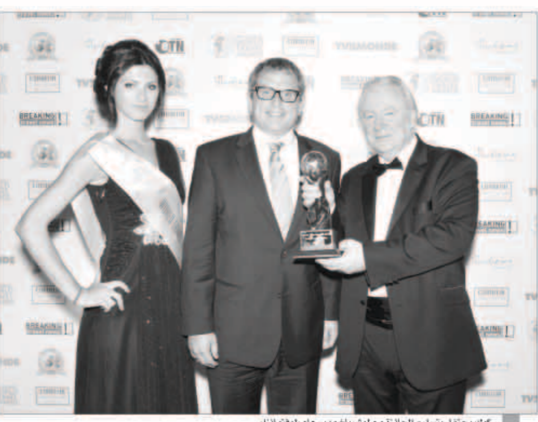
كوك يحتفل بتسليم الجائزة مع لوشرباخ مدير عام «لوفتهانزا».

أعلنت الخطوط الجوية الألمانية «لوفتهانزا» عن فوزها بجائزة «أفضل شركة طيران رائدة في أوروبا» للعام الثالث على التوالي خلال حفل توزيع «جوائز السفر والسياحة العالمية» المرموقة الذي أقيم مؤخراً في تركيا، وذلك على إثر عملية تصويت شملت 230 ألفاً من الخبراء والمتخصصين العاملين في السفر والسياحة والضيافة حول العالم. وجاء اختيار «لوفتهانزا» لنيل الجائزة ضمن قائمة ضمت 11 شركة من أكبر شركات الطيران الأوروبية. وقال جراهام إي كوك، رئيس ومؤسس «جوائز السفر والسياحة العالمية»: «تحتفي «جوائز السفر والسياحة العالمية» طيلة 20 عاماً ببتك العلامات التجارية التي أسهمت في تميز قطاع السفر والسياحة. وفي هذه الفترة تقود لوفتهانزا فئة شركات الطيران المرموقة، حيث فازت بلقب أفضل شركة طيران رائدة في أوروبا ست مرات عامة، والأول للعام الثالث على التوالي. ولا شك أنه اعتراف وتقدير رائع من قبل آلاف الخبراء والمتخصصين في السفر والسياحة حول العالم». من جانبه، قال جينز بيشهوف، الرئيس التجاري في الخطوط الجوية الألمانية «لوفتهانزا»: «دعم حصولنا على هذه الجائزة اعترافاً رائعاً وإشادة مذهلة بالتزام ما يزيد عن 100 ألف من الميلاء العاملين في مجموعة لوفتهانزا سواء أرضاً أو جواً. كما تعكس الجائزة مدى التقدير تجاه جهودنا المكثفة لتقديم أفضل شبكة تغطية