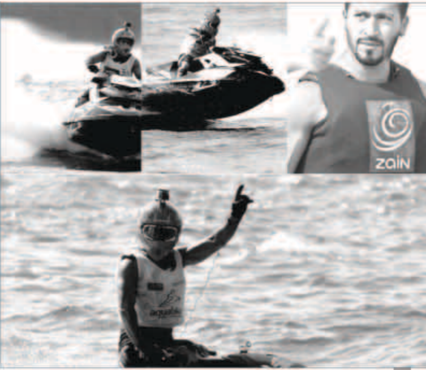
البطل يحمل شعار «زين»