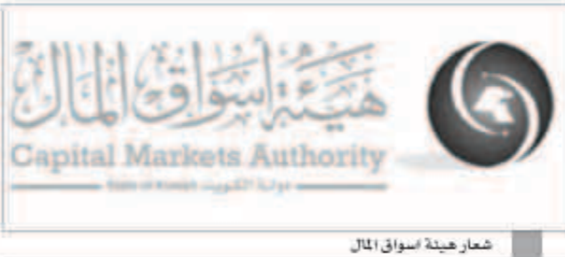
شعار هيئة أسواق المال

وتعدت الشبكات تلك التي قيام متداولين باجراء صفقات في السوق الرسمي على سهم بخص خصص سعر السهم المتداول عليه وقيام أحد المتداولين باجراء صفقات عدة في السوق الرسمي بكميات قليلة وبأسعار غير سائنة بهدف حث الآخرين على شراء أو البيع. وعلاوة على ذلك اشتملت الشبكات بحسب الإحصائية على قيام متداولين بالتداول لرفع سعر السهم وحث الآخرين على الشراء وخلق إحاء زائف بشأن التداول الفعلي للسهم وأخرى تم تحويلها إلى شبيهة لصاحب حساب شخصي لدى موقع التواصل الاجتماعي «تويتر» بتقديم استشارات مالية واستثمارية دون الحصول على ترخيص من الهيئة.