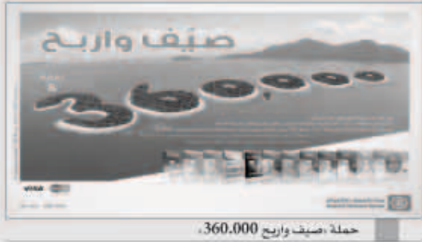
حملة «صيف واربح» 360.000.