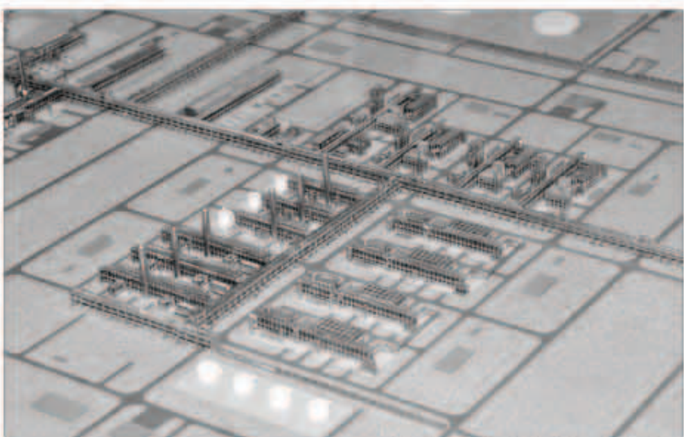
مجمع نفطي في معرض الكويت للنفط والغاز

وشدد على ضرورة الاستثمار في إقامة هذا الحدث مرة كل عامين موضحاً أن الدورة الأولى لأي مؤتمر ومعرض عادة ما تكون دورة تكوين الهوية التي يتحدد على أساسها الكثير من أسلوب إدارة المؤتمر والمعرض وتحدد مدى فعاليته وتأثيره والاستفادة منه.