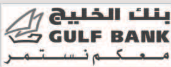
شعار بنك الخليج

بنك الخليج أنه بالإضافة إلى كونه حساب يمنح جوائز نقدية، فهو يشجع العملاء أيضاً على توفير المال، فكلما زاد المبلغ المودع وطالت مدة بقائه في الحساب زادت الفرص المتاحة للفوز. كما يمنح حساب الدانة أيضاً العديد من الخدمات المتميزة منها خدمة «بطاقة الدانة للإيداع الحصري» التي تمنح عملاء الدانة حرية إيداع النقود في أي وقت وبأساليبهم، إضافة إلى خدمة «الحاسبة» التي تمكن عملاء الدانة من حساب ما لديهم من فرص للفوز في سحب الدانة.