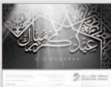
بطاقة هائلة من «برقان»

أعلن بنك برقان أن فرع المطار سوف يتابع ساعات العمل الاعتيادية وذلك خلال عطلة عيد الأضحى المبارك. هذا وسيعمل الفرع ابتداءً من الساعة 8:00 صباحاً وحتى الساعة 10:30 مساءً، وتعكس هذه المبادرة اهتمام البنك في تقديم الخدمات المصرفية كافة للمسافرين أثناء العطلة. لمزيد من المعلومات والاستفسارات حول كافة خدمات ومنتجات بنك برقان خلال أيام العيد، يتعين على العملاء الاتصال بمرکز خدمة العملاء على 1804080. وبهذه المناسبة، يقدم بنك برقان للجمعيات بأطباق النهائي بعيد الأضحى المبارك وكل عام وأنتم بخير.