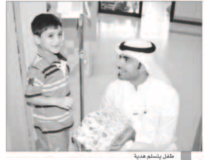
طفل يتسلم هدية