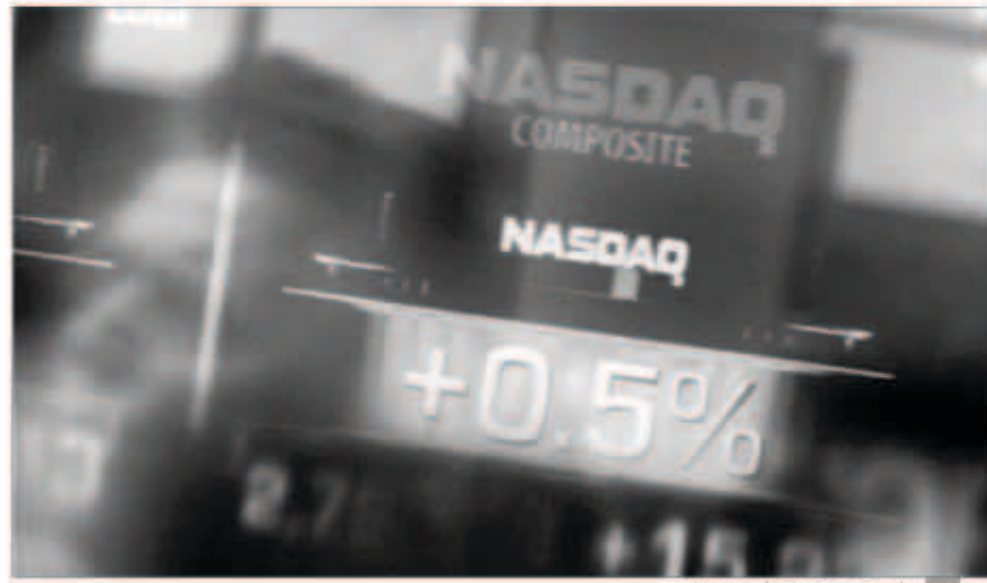
أسواق المال تتربص أحر التقلبات

ومن ناحية أخرى، أفادت الصحف الألمانية أن بنك Bundesbank الألماني قد حذر من أن أسعار الشقق السكنية في المدن الألمانية الكبرى قد تتجاوز حد العقول بنسبة قد تصل إلى 20 في المئة، وبالتالي فإن هذا التحذير سيغرز من مخاوف ألمانيا حيال السياسة النقدية التي يتبناها البنك المركزي الأوروبي باعتبار أنها لا تتناسب مع وضع البلاد، وبالتالي فإن السياسة لتتبعه لن تتناسب مع كافة الدول في منطقة اليورو وبشكل