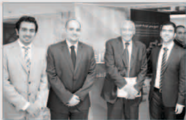
مؤتمرو بيتك، مع سفير الكويت في بريطانيا

رعى بيت التمويل الكويتي «بيتك» المؤسسة الإسلامية الرائدة عالميا، مؤتمر الاتحاد الوطني لطلبة الكويت - فرع المملكة المتحدة وأيرلندا والذي اقيم في المملكة المتحدة - لندن بحضور سفير الكويت لدى بريطانيا خالد الدويسان، ومشاركة عدد كبير من الطلبة والخريجين والشخصيات الإعلامية، ويشترك «بيتك» في غالبية الفعاليات والأنشطة التي ينظمها الاتحاد انطلاقا من مسؤوليته الاجتماعية وحرصا على دعم شريحة الشباب بشكل عام والطلبة بشكل خاص.