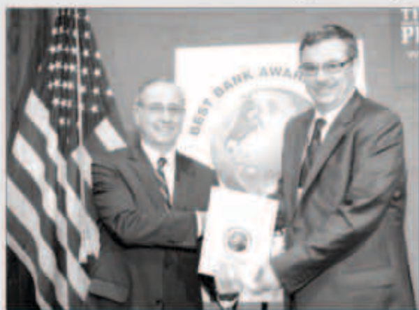
أفق إيوان «بيتك» يتسلم الجائزة

فاز بيت التمويل الكويتي التركي «بيتك-تركيا» بجائزة أفضل مؤسسة مالية إسلامية في تركيا لعام 2013 من مجلة جلوبل فايننس العالمية. تتويجا لجهود متميزة ونجاح متواصل في السوق التركي والسوق المجاورة، بما يؤكد أن «بيتك-تركيا» على الطريق الصحيح لتصدر قائمة المؤسسات المالية الإسلامية في تركيا وتحقيق انتشار في أسواق واعدا ومهمة مثل ألمانيا وبعض دول الخليج.