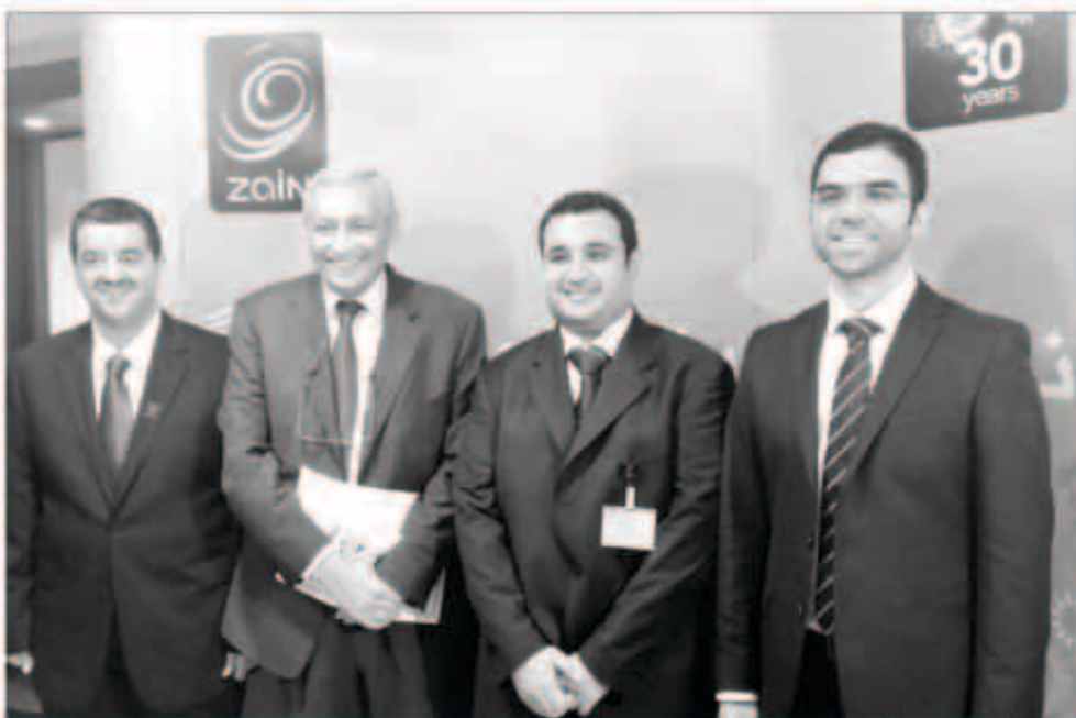
المشاركين في المؤتمر