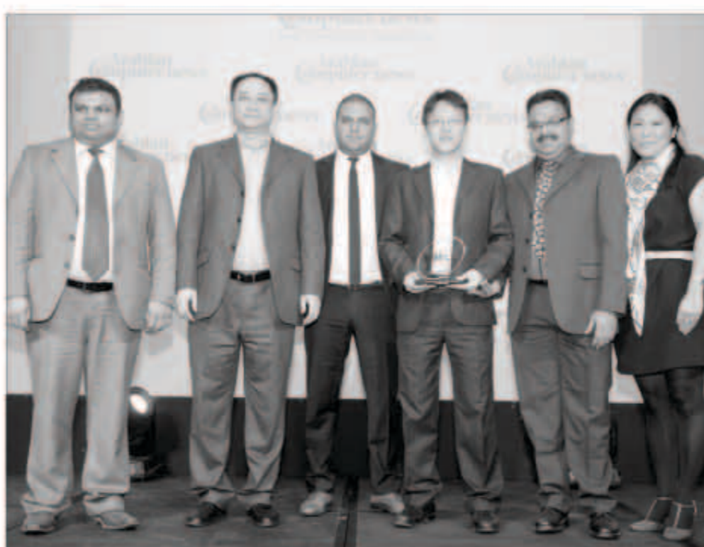
هواوي تتسلم الجائزة

حصلت شركة «هواوي»، الرائدة عالمياً في توفير حلول تقنية المعلومات والاتصالات، جائزة «أفضل مزود لهذا العام في مجال الأنظمة والمكونات المادية للأجهزة الموجهة للمشاركة»، وذلك ضمن فعاليات الدورة التاسعة من حفل توزيع HYPERSHIELD AWARDS 2013. وقد تم تكريم الشركة بهذه الجائزة إشادة بمساهماتها البارزة على صعيد تطوير حلول وخدمات ومنتجات تقنية المعلومات والاتصالات الخاصة بقطاع المشاريع في منطقة الشرق الأوسط. وقد نوهت لجنة التحكيم، التي ضمت نخبة من كبار قادة القطاع الصناعي، إلى أن استثمارات «هواوي» المتواصلة في مجال البحث والتطوير شكلت إحدى أهم العوامل التي أخلقت لنيل هذا التكريم.