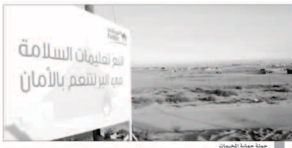
حملة حماية المخيمات