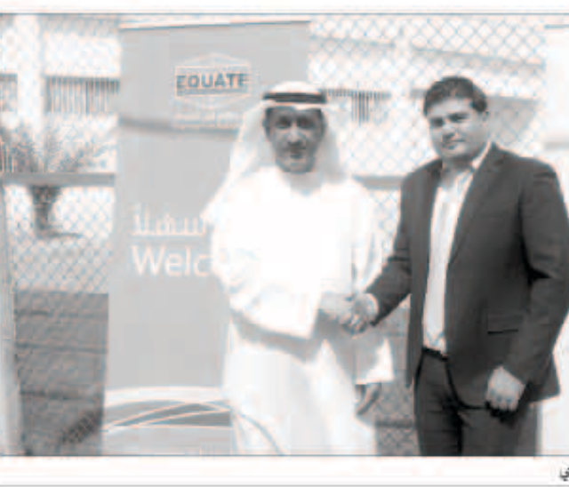
ال من علي والطاق مع أكاديمية بوكا

المعز في المستقبل». تمثل شركة إيكويت للبترول وكيموايات التي تأسست عام 1995 شركة عالمية بين شركة صناعة الكيموايات البترولية وشركة داو لكيموايات وشركة بوبيلان للبترول وكيموايات والقرين لصناعة الكيموايات البترولية. ويبدأت شركة إيكويت عمليات الإنتاج في شهر نوفمبر من العام 1997، وهي حالياً المشغل الوحيد لمجموعة متكاملة من المصانع ذات المواصفات العالمية التي تنتج أكثر من 5 ملايين طن سنوياً من المواد البترولية وكيموايات عالية الجودة التي يتم تسويقها في الشرق الأوسط وآسيا وأفريقيا وأوروبا.