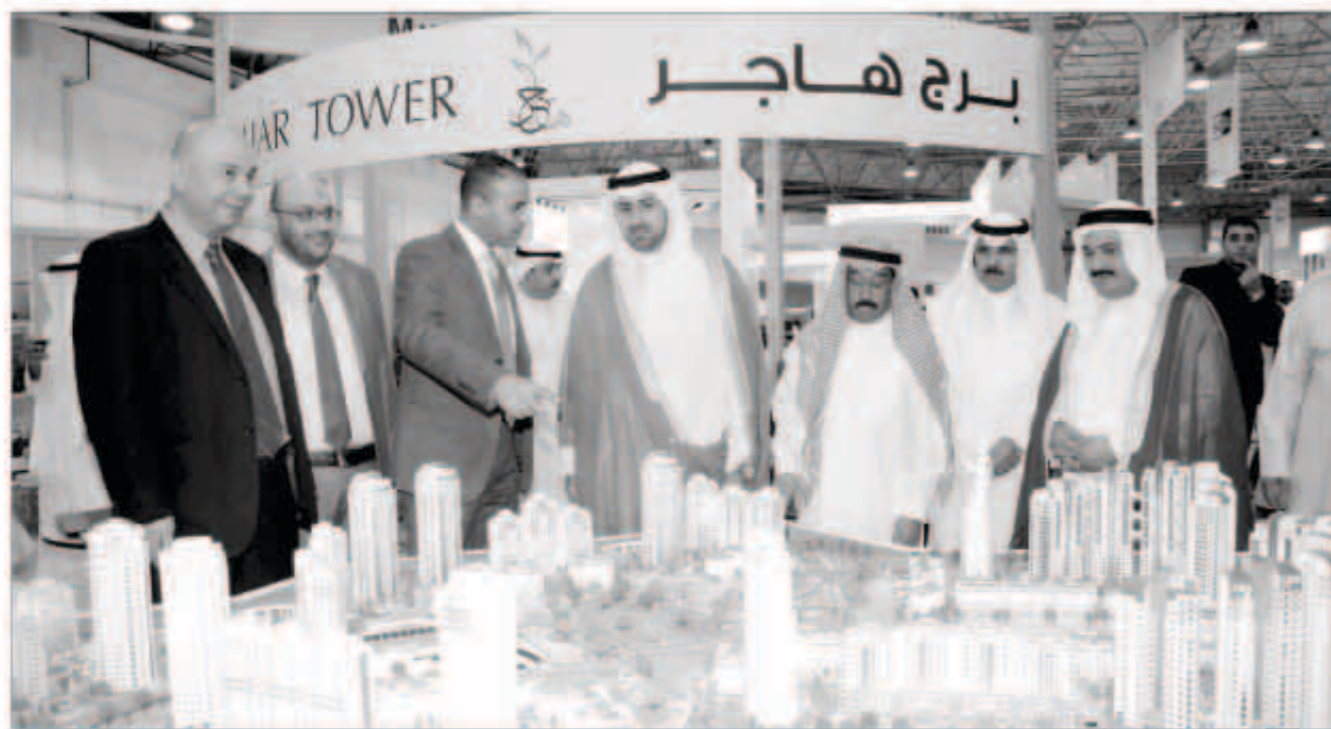
جولة في معرض العقار