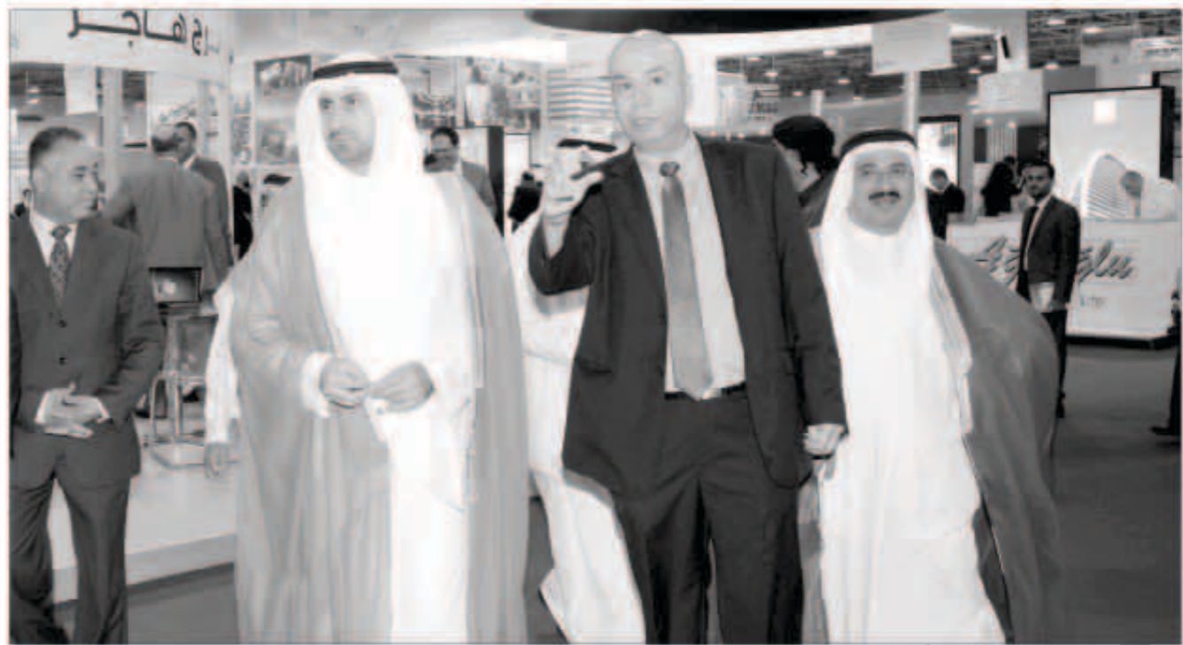
الشيخ نهر الصباح مفتتحا المعرض

المالية للكويت ورغبة الكثيرين في الاستثمار الخارجي في القطاع العقاري. وبين ان هناك زيادة في الشقق السكنية التي توفر بديلاً للمواطن لمواجهة ارتفاعات الاسعار في السكن الخاص وهي متنوعة لجميع افراد المجتمع. ومن جانبه ، أوضح رئيس مجلي إدارة مجموعة توب اكسبو الشيخ مالك الصباح ان الدورة السادسة للمعرض استقطبت مجموعة كبيرة و متنوعة من الشركات العقارية تتجاوز عددها 66 شركة تعرض منتجاتها المتنوعة بين الاراضي والفلل والشقق وصكوك الائتلاف في أكثر من 200 مشروع في 15 دولة عربية وأوربية. وبين ان تلك الشركات حجرت مساحات بلغت 3150 متر مربع ، في دلالة واضحة على الاهتمام الذي تبديه الشركات بمعرض الكويت الدولي للعقار.