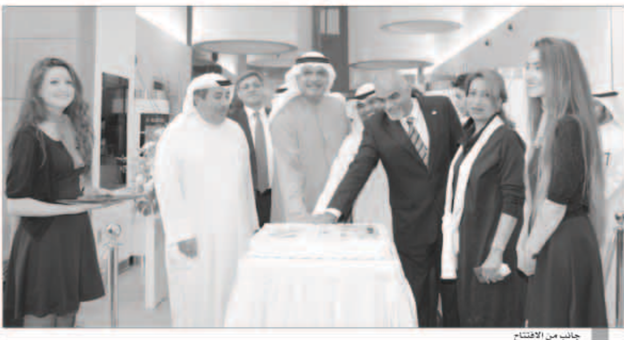
جانب من الافتتاح