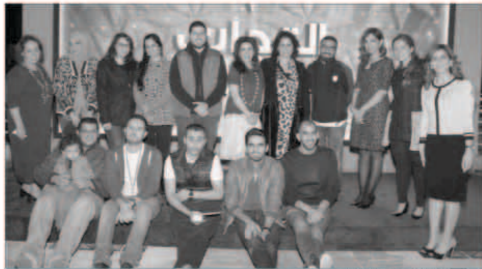
المشاركون في مسابقة التجاري

بالحضور واستعرضت في إيجاز مزايا البطاقات الائتمانية والخدمات المصرفية المميزة التي يقدمها التجاري للعملاء. على الجانب الآخر - وفي أجواء