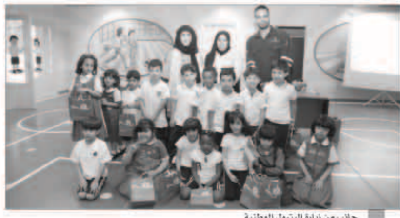
جانب من زيارة البترول الوطنية

محاضرات عن سبل الحفاظ على البيئة، وكيفية التصرف في الحياة اليومية سواء في المدرسة أو البيت أو الحي، وعرفوا محاضرات عن التبول اللاإرادي لدى الأطفال وخاصة التبول الليلي. وفي المجال البيئي، قدم مهندسو ومهندسات الشركة