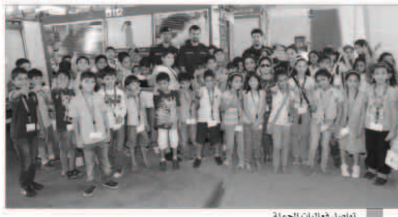
تواصل فعاليات الحملة