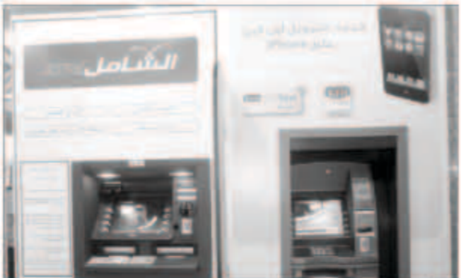
سيارات موبيل بيتك، وأجهزة الشامل

يواصل بيت التمويل الكويتي «بيتك» تقديم خدماته للعملاء خلال عطلة ذكرى المولد النبوي، عبر خمس قنوات إلكترونية وتقليدية على مدار الساعة طوال فترة العطلة، حيث يمكن للعملاء «بيتك» إتمام معاملاتهم المصرفية عبر فرع المطار، ومركز الاتصال، وماكينات السحب الآلي وموسبي «بيتك»، والموقع الإلكتروني kfh.com. وذلك لتحقيق تواصل دائم من «بيتك» وعملائه وضمان انسيابية الخدمات. ويعمل فرع المطار على مدار الساعة من خلال موظفين وكادر بشري مدرب بمساعدة جهازين للسحب والإيداع الآلي «الشامل»، وكذلك يقدم موقع «بيتك» على الإنترنت kfh.com نحو 150 خدمة مجانية. علاوة على ذلك سيعلن نحو 60 جهازا للسحب والإيداع الآلي «الشامل»، منتشرة في مختلف المناطق وتتيح للعملاء منظومة متكاملة من الخدمات مثل فتح الودائع الاستثمارية وطلب دفتر شيكات والتحويل إلى حسابات داخل وخارج «بيتك» وغيرها من الخدمات التي تجعل