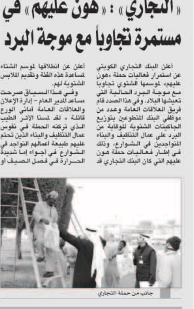
جانب من حملة التجاري التجارية