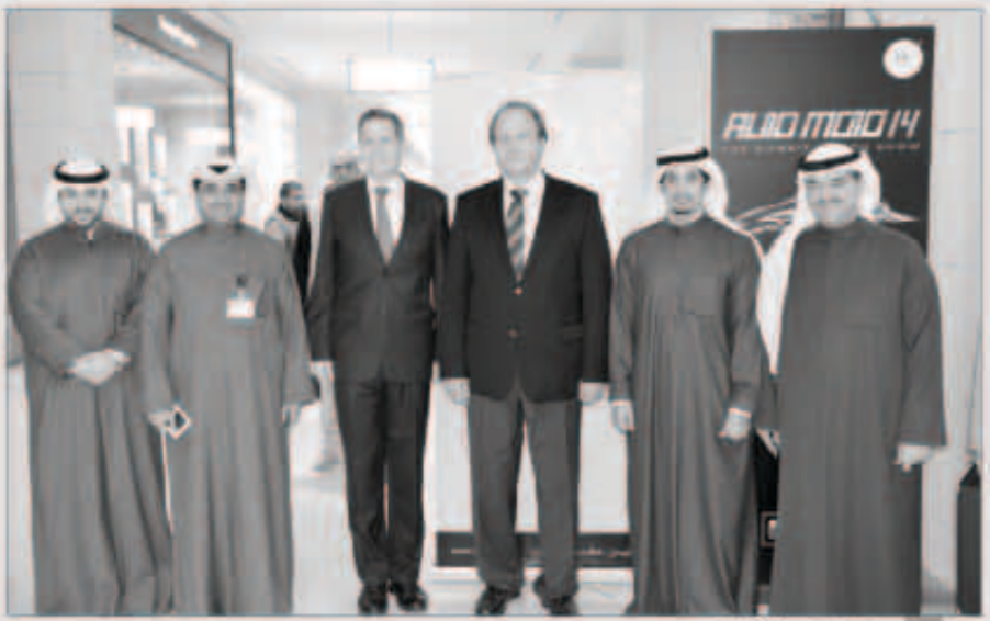
جانب من رعاية زين

أعلنت زين أكبر شبكة اتصالات متطورة في الكويت عن رعايتها الملائمة لمعرض الكويت للسيارات Auto Moto 2014، الذي تستمر فعاليته حتى الخامس والعشرين من الشهر الحالي في مول 360، والمقام تحت رعاية معالي وزير الإعلام ووزير الدولة لشؤون الشباب الشيخ سلمان الحمود الصباح. وذكرت الشركة في بيان صحفي أن رعايتها للمعرض للعام الثاني على التوالي جاءت من منطلق اهتمامها بالأنشطة والبرامج التي تدعم وتساند الطاقات الوطنية الشابة، مبيّنة أنها وفي هذا السياق حرصت على تخصيص جزء كبير من مبادراتها هذا العام لغفّة الشباب وأفادت الشركة أن هذا المعرض يجد متابعيه وإهتمام كبير لكافة عشاق السيارات والدرجات النارية، حيث سيكونوا على موعد مع الإثارة والمتعة في أكبر معرض للسيارات في الكويت، وأوضحت زين أن المعرض يجمع تحت سقف واحد أكثر من 70 سيارة ودراجة نارية من أكبر وأفخم الموديلات العالمية لأكثر من 27 علامة تجارية، بالإضافة لمجموعة من وكلاء الدرجات النارية. يعرض أحدث السيارات والدرجات النارية لهذا العام، مبيّنة أن الدورة الثانية من المعرض توفر فرصة رائعة للزوار للتعرف على آخر ما توصل إليه صانعو المركبات من تكنولوجيا حديثة في عالم السيارات. معرض «أوتو موتو 2014»، هذا العام تجازى ملحوظاً، حيث أنه يعد أكبر معرض سيارات يقام في الكويت، حيث يعد المنطلق المثالي لمصنعي السيارات بين صانعي السيارات من جميع أنحاء العالم ومحبيها والمختصين بها في الكويت.