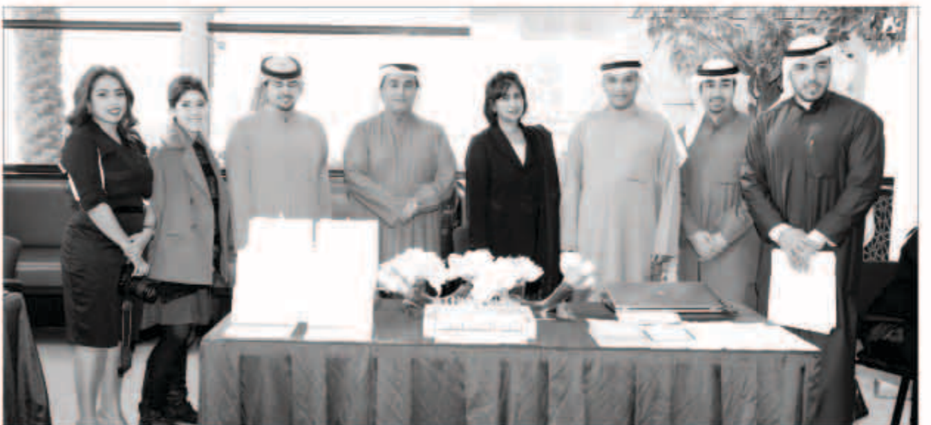
جناح بنك التسليف

■ رواد المعرض..المطبوعات كانت فرصة للإطلاع على تاريخ البنك