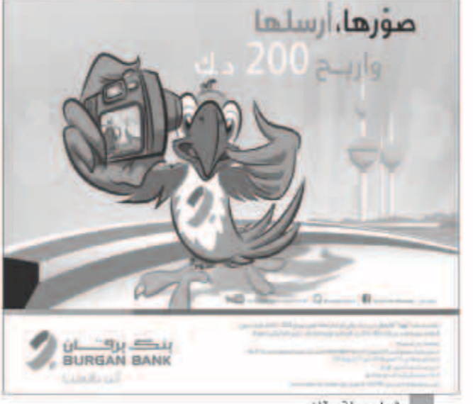
شعار حملة برقان

مركز دراسات الطاقة العالمية بمراجعة توقعاته بنسبة أكبر، فقد توقع بارتفاع من 1.2 مليون