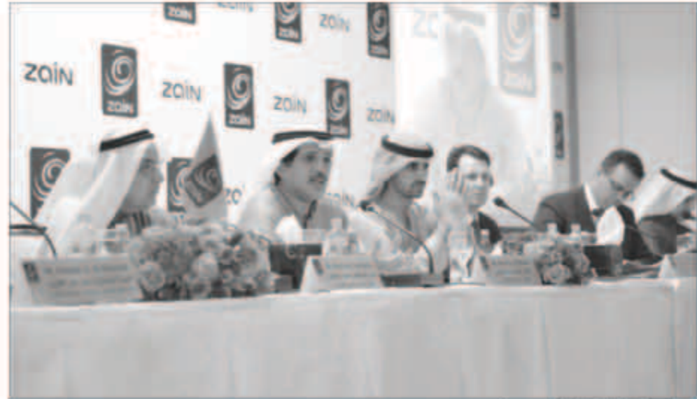
البنوان مترئساً العمومية

16 % نسبة الزيادة في قاعدة عملاء «زين» العراق خلال العام الماضي